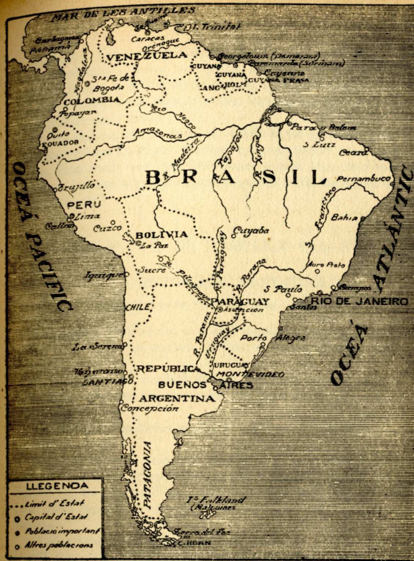
AMÈRICA DEL SUD

Les pampes són immenses planures sense arbres, degut a la gran sequedat del clima. Els arbres es troben únicament a la vora dels rius.