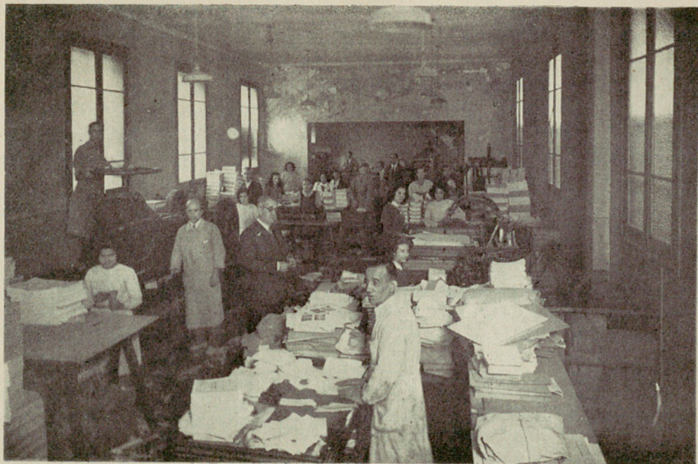
Aspecto de una de las naves de la Sección de Encuadernación