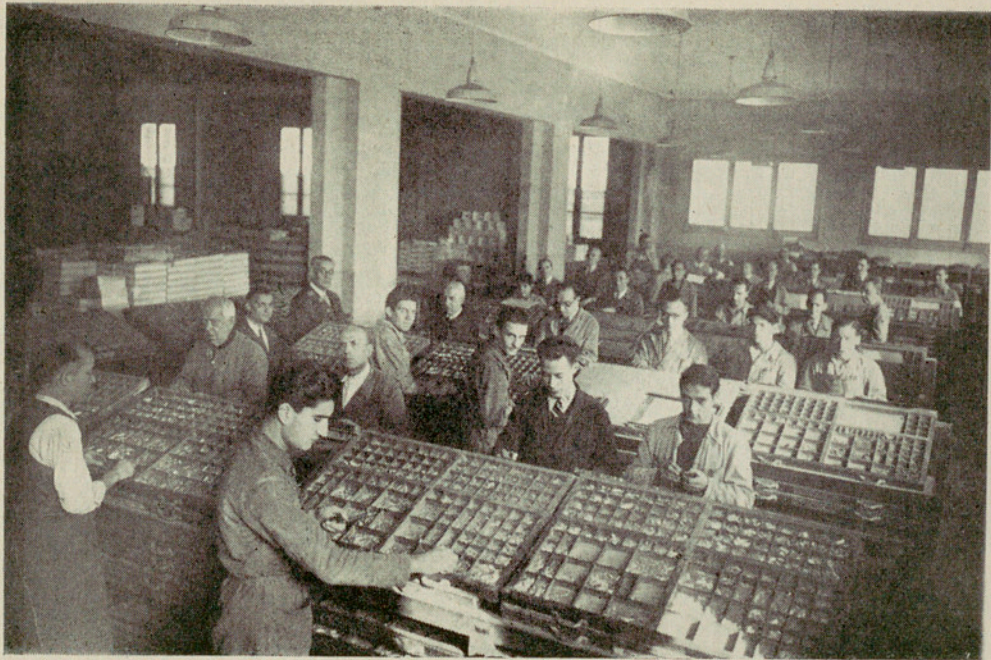
Vista parcial de una nave de la Sección de Cajas