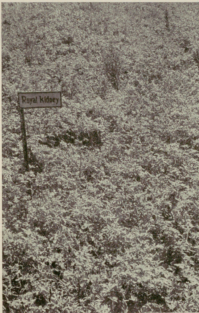
«Royal Kidney», una de las variedades mejor adaptadas a nuestra comarca