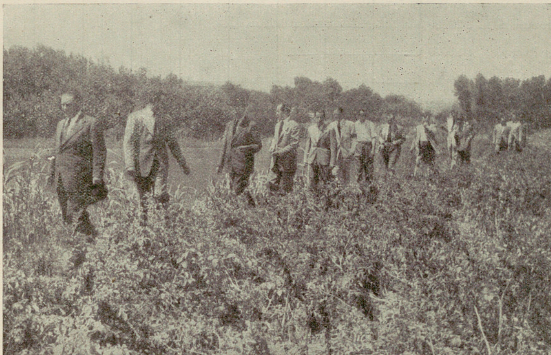
Las Excmas. Autoridades en su visita al Campo de La Roca

E n un terreno cedido por su propietario, D. José Pujol Recordá, se encuentra este Campo de Experimentación, con una extensión sembrada de 30 áreas 23 centiáreas. La siembra se efectuó el día 10 de Marzo y la recolección para todas las variedades el día 26 de Julio. Tuvo por tanto el ciclo vegetativo una duración de 138 días para todas las variedades. Fué abonada la tierra con estiércol vacuno (2,000 kgs.) antes de la siembra y al realizarse ésta, con 500 Kgs. de un compuesto de sulfato amónico al 40 por 100, otro 40 por 100 de superfosfato de cal y un 20 por 100 de cloruro de potasa, desparramándose, una vez crecidas las plantas, una dosis de sulfato amónico. Todas las variedades fueron regadas semanalmente.