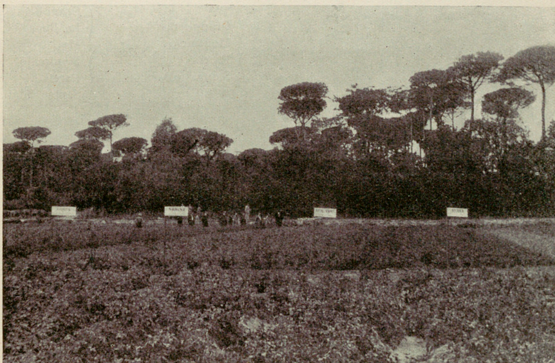
Campo de Experimentación de Santa Eulalia

Para el tratamiento de las enfermedades criptogámicas y de insectos se emplearon caldos cúpricos y Gesarol.