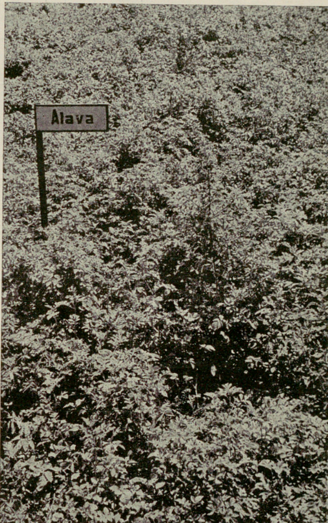
«Alava», la variedad de mayor promedio de producción en las tres campañas

Se empleó para el abono del Campo un compuesto a base del 40 por 100 de sulfato amónico, 40 por 100 de superfosfatos y 20 por 100 de cloruro de potasa. El peso total en bruto de las patatas sembradas fué de 441 kgs., obteniéndose un peso neto de 6,069 kgs. de producción, lo que representa un promedio en el rendimiento general de 13'7 kgs. por kg. de patatas sembradas. Cabe señalar que el mal rendimiento obtenido por la variedad Iturrieta fué debido al mal estado de la simiente recibida. Es preciso también señalar que las continuas lluvias que durante todo el mes de Mayo se produjeron impidieron el correcto cuidado de la plantación, no pudiéndose practicar a su debido tiempo las labores de escarda, dando lugar a un normal desarrollo de las hierbas perjudiciales al cultivo. Las plantas fueron tratadas dos veces con Clorasol, para combatir el «escarabajo».