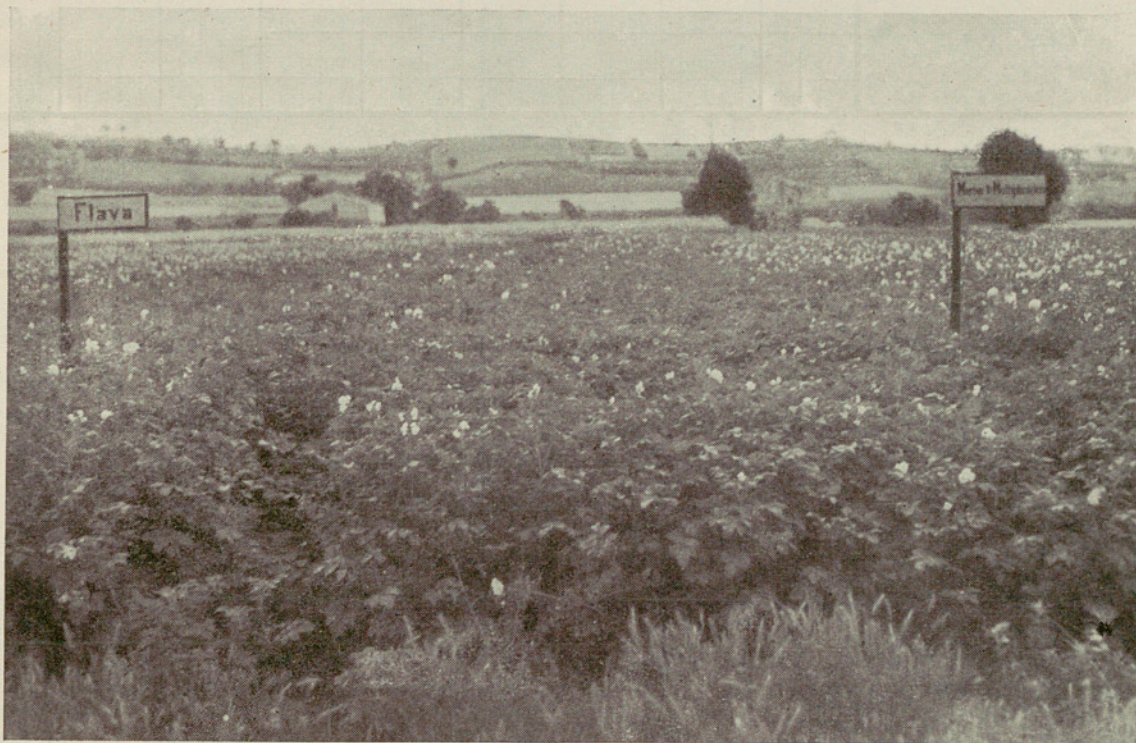
Vista parcial del Campo de Experimentación de Granollers

Este Campo se encuentra emplazado, igual que en las campañas anteriores, en la carretera de Masnou. La extensión total sembrada fué de 54 áreas 76 centiáreas. La siembra tuvo lugar los días 20 y 21 de Marzo y la recolección, para las variedades Arran Banner, Majestic y Azaceta, el día 5 de Agosto, y los días 26 y 27