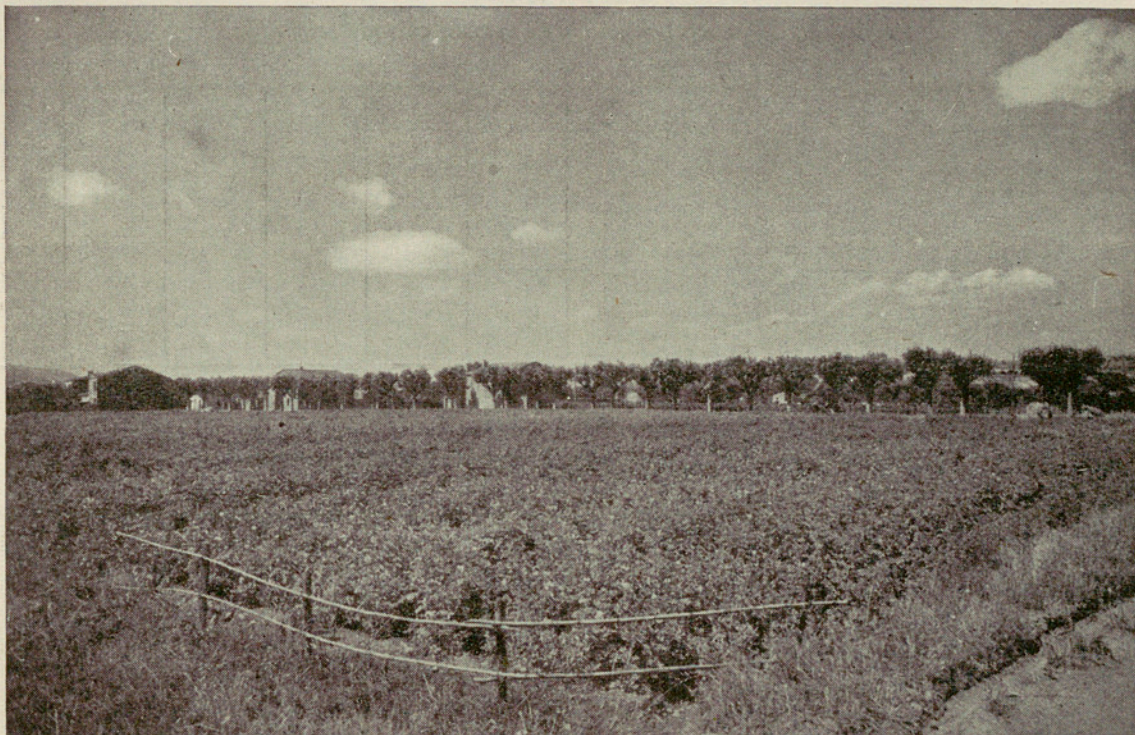
Campo de Experimentación de Parets

La extensión sembrada en la última campaña fué de 34 áreas 5 centiáreas, verificándose la siembra de los tubérculos el día 8 de Marzo y la recolección el día 15 de Julio, salvo para las variedades Alava y Sergen, que fueron recogidas