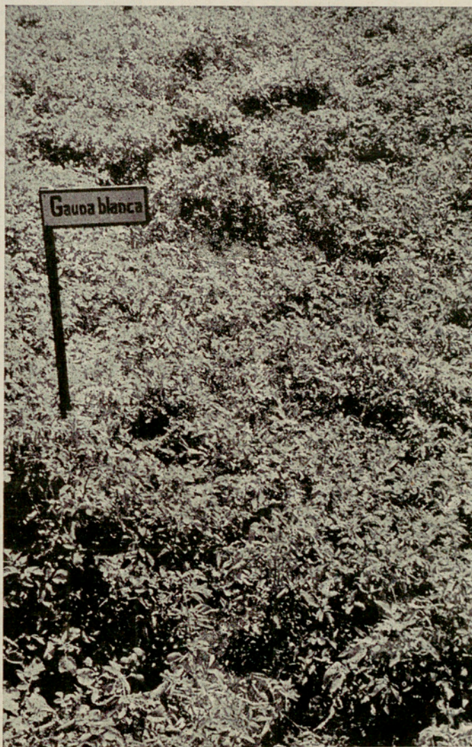
«Gauna Blanca», variedad de excelente promedio de producción en las tres campañas

Empleóse, para tratamiento de las plantas, pulverizaciones con sulfato de cobre y con arseniato de plomo. La variedad que mayor rendimiento ha dado en este Campo ha sido la Arran Banner.