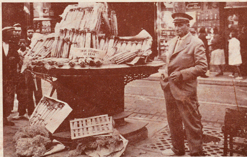
Exposició a la Rambla de Barcelona dels Lots premiats