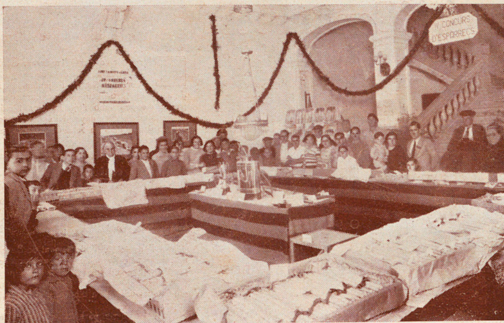
Vista del concurs any 1935