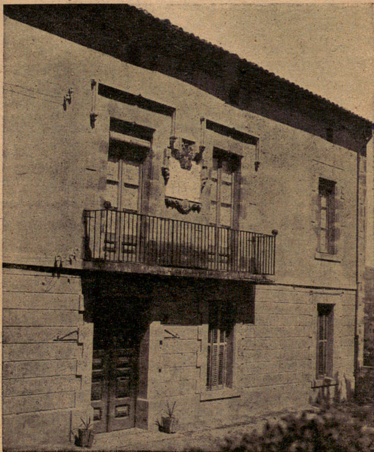
Balcón central de la fachada del «Manso Escorial» con la lápida conmemorativa del Centenario de la fundación del Instituto.