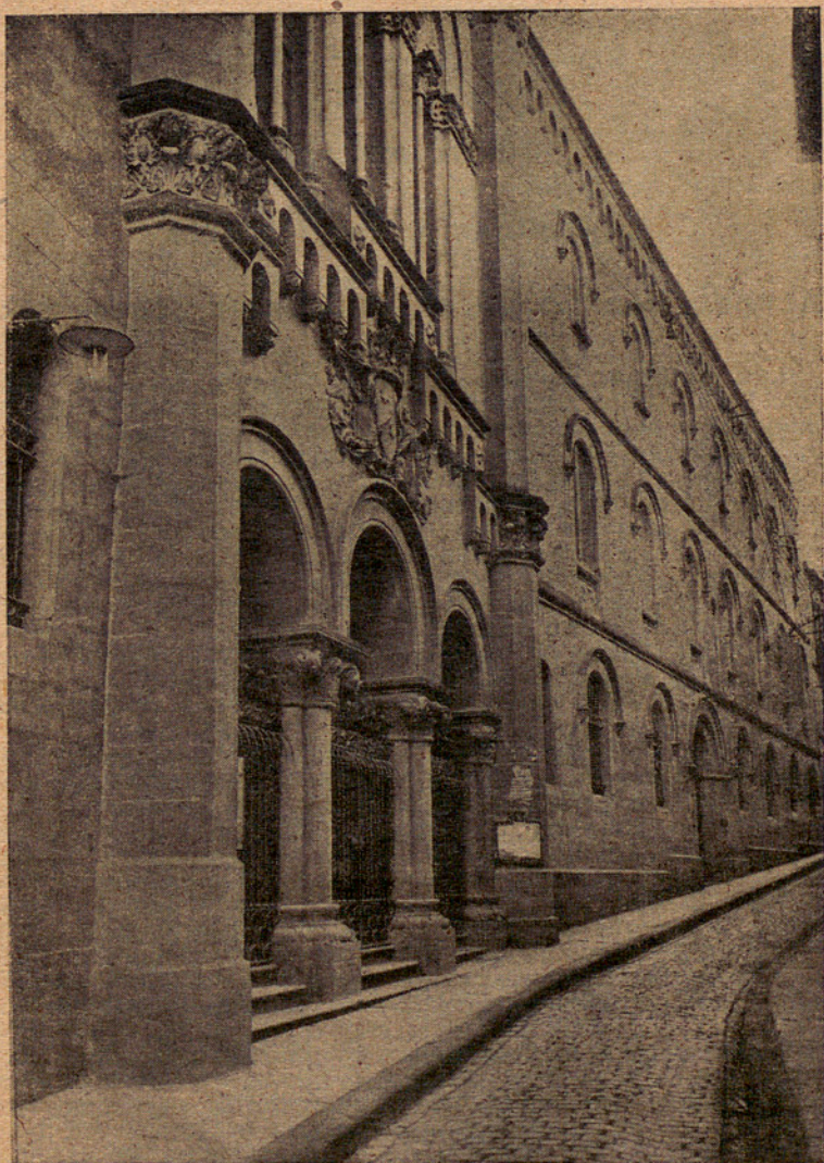
Parte de la fachada de la iglesia y edificio de la Casa Madre y Noviciado de Vich.