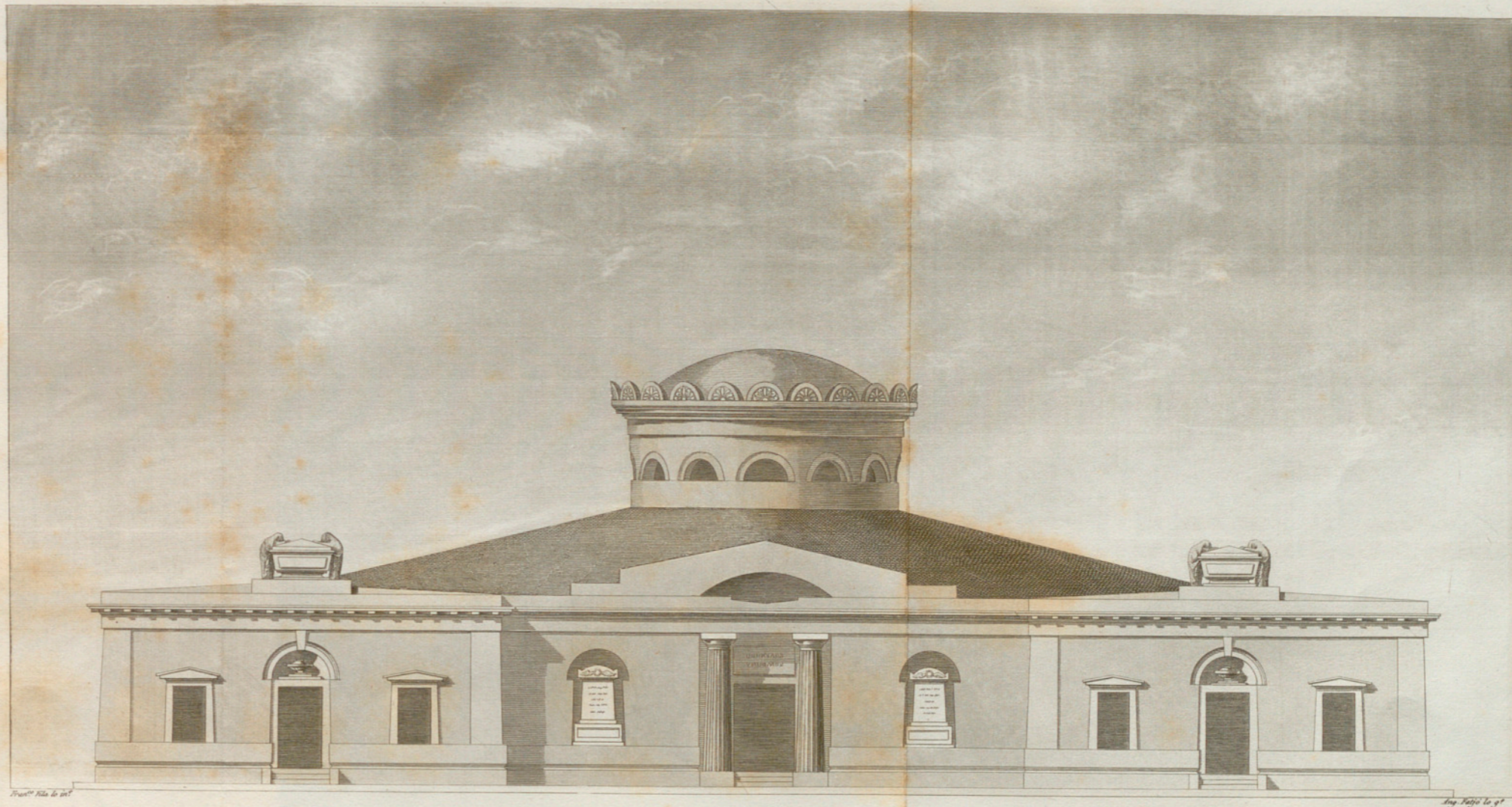
FACHADA PRINCIPAL DEL RECINTO MORTUORIO.