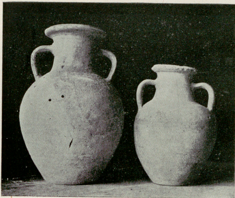
Vasijas halladas en el interior de la cueva de “Na Figuera”, Parella (Menorca)