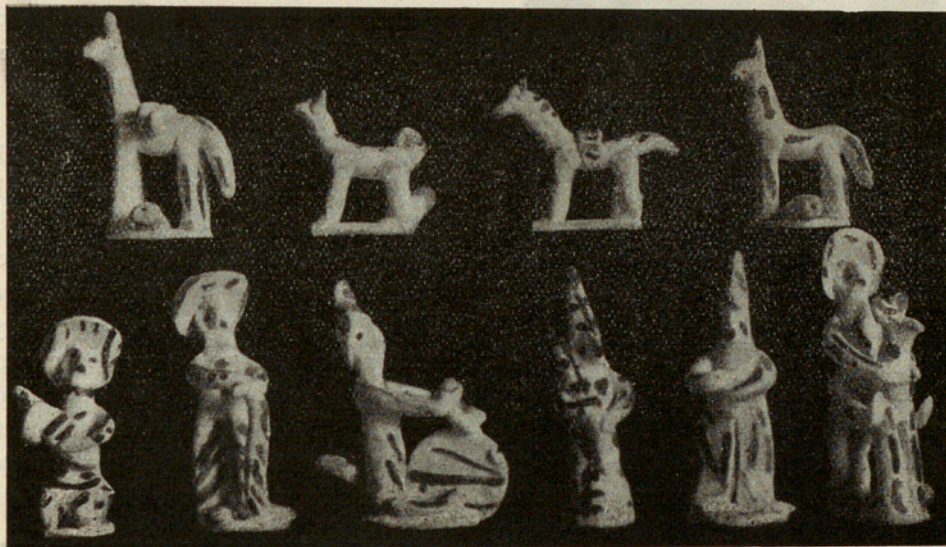
Arriba: Borrico cargado. — Perro. — Caballo ensillado. — Borrico. Abajo: Guitarrista. — Campesino con cayado. — Motociclista. — Encapuchado con cirio. — Idem, sin él. — Jijete en un borrico.

Antes de clasificar tipos, conviene decir dos palabras de técnica. Los siurells se fabrican en las alfarerías, sobre todo en las pequeñas, teniendo este trabajo un marcado carácter familiar; y en cierto modo viene a ser como una pequeñísima artesanía, en último grado de modestia. Lo curioso es que,