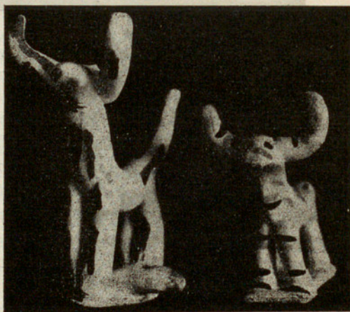
Pareja de toros con grandes cuernos curvos

Los siurells más recientes, los vidriados, son más sabios. Su barro y modelado es exactamente igual al de los otros; pero se sigue la marcha normal en la cerámica vidriada con dos cochuras. Su gama colorística es muy animada: verde oscuro y verde claro, azul de Prusia en dos concentraciones; negro, marrón, amarillo pálido, naranja y rojo sangre. Tienen un naturalismo relativo (hay calzones azules y casacas amarillas), marcando incluso detalles de la cara