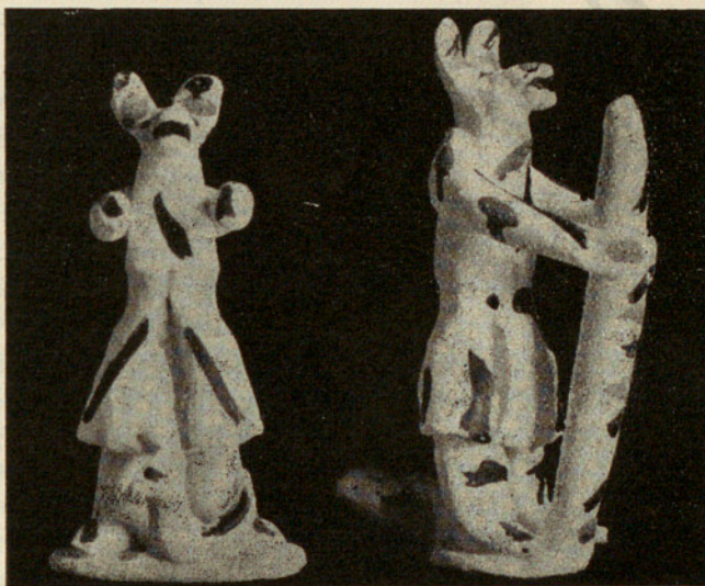
Cofrade zoomórfico, danzando y con un ave a los pies. — Idem, con un bastón en las manos.

Pero sin duda el problema más apasionante de esta cerámica es el de sus obscurísimos orígenes, que se pierden en una vaga tradición popular. Si prescindimos de la fecha actual de su producción, y tenemos en