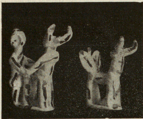
Campesino arando. — Toro con alas de mariposa en los cuartos traseros.

jos de ninguna clase, excepto la continuidad de una tradición transmitida de padres a hijos, incluso entre individuos analfabetos. No poseen, por tanto, la más ligera idea