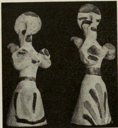
Mujer con una ofrenda. — Ídem ¿en paso de danza?

sedentes son hombres en cuclillas con un ave delante, acaso un payés en el mercado; el tañedor pulsa un instrumento elemental de cuerda, posible alusión al guitarrista. Existe un tipo, poco frecuente, de hombre en cuclillas, con torso semiflexionado, con una mano apoyada sobre un muslo, el otro brazo levantado a la altura de la cabeza y la mano