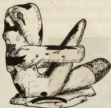
Personaje fantástico de tipo marino

persiguen al santo con ademanes frenéticos. La idea totémica se afirma por tener todos los siurells de ese tipo una cabeza que recuerda la de los asnos de la misma cerámica, sin ninguna otra variante. Hay que recono-