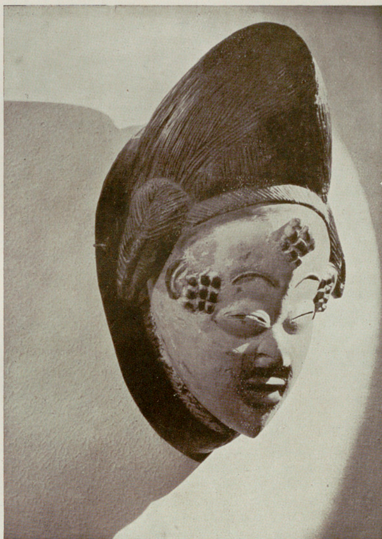
Máscara de baile m'pongwé (Gabón Francés). Madera ligera pintada de blanco, altura 32 cms.