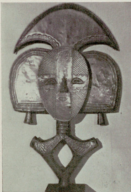
Figura ancestral bakota (Congo Medio). Madera dura recubierta de láminas de cobre amarillo y rojo, altura 74 cms. COLECCION VILLE-FABRA, París.

El Arte negro se mueve entre el naturalismo y el realismo observados con los sentidos refinados de quienes confían en ellos para su lucha cotidiana. Las cabezas de Ife, cuya antigüedad remonta al siglo XII, son tan bellas que no desdican de las obras clásicas; es posible que si un griego hubiese representado uno de sus modelos no lo habría interpretado de manera muy diferente. Tuvieron también la