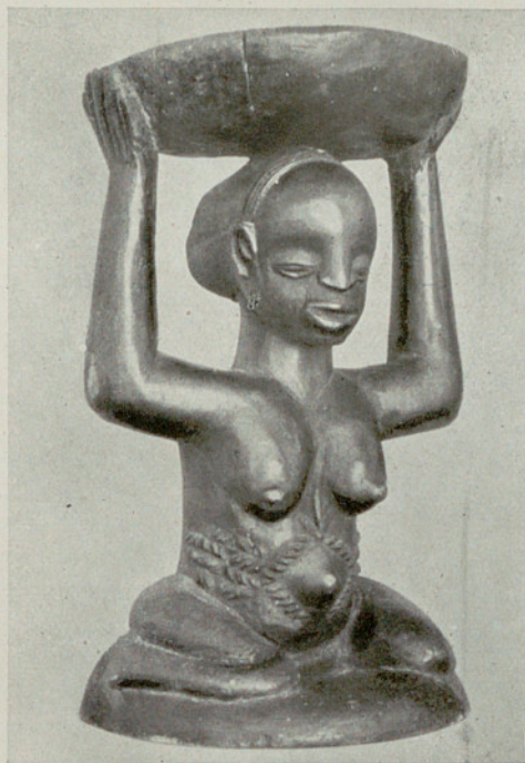
Asiento esculpido de madera tallada, procedente de Urua (Congo Belga) Según E. von Sydow, Kunst der Naturvölker.

era habitable; los pueblos mediterráneos se aventuraron a navegar por la costa del Africa Occidental—así se desprende de viejas mitologías y leyendas—, Egipto, sobre todo, pudo aportar algo; los nubios, en contacto constante con los egipcios históricos, pudieron llevar migajas de gran cultura hasta la región de los grandes lagos siguiendo el valle del Nilo y descender desde allí algunos vestigios por los ríos que tributan al amplio curso del Congo, que nada hay imposible para los comerciantes de cualquier raza y continente. Pero nada se puede afirmar con seguridad de influjos exteriores hasta que la Arqueología africana salga de su fase inicial.