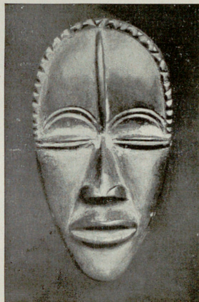
Máscara de madera de la Costa de Marfil, procedente del Africa Occidental. Según Eckart von Sydow, Kunst der Naturvölker.

con el mundo animal es de origen prehistórico en casi todos los pueblos. No debemos sonreír, pues de esas danzas, muy evolucionadas, nació el teatro cuando se introdujo el diálogo, y por eso los supercivilizados no prescindimos de ellas como decoración de nuestros locales. Son básicas en las sociedades secretas, las agrupaciones de extrañas danzas y ritos de iniciación, poderosas barreras de contención del Islam. Algunas, como la m'pongwé (Gabón Francés), son de extraordinaria belleza; otras ofrecen aspecto javanés; una máscara de la Colección, probablemente m'pongwé (Gabón), acusa carácter egipcio; las antiguas cabezas de Ife son de excelencia extrafricana, sin olvidar que lo mismo se aplica a los fundidores de Benin y Dahomey, entre los que existía la tradición de que su Arte vino de fuera. Problema apasionante es éste, sobre el que se ha disparado muchísimo. No hay lugar aquí para abordarlo, pero al tiempo que prevenimos al lector contra erróneas fantasías y fáciles comparaciones que muchas veces son coincidencias y no influjos remotos, no excluimos la posibilidad de relaciones con centros de cultura superior. El Sahara no siempre fué desértico, durante el Neolítico