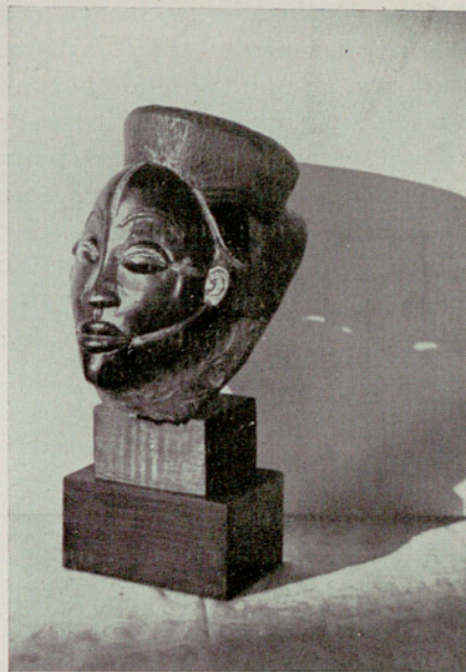
Máscara de danza m'pongwé (?) (Gabón) Madera ligera patinada de negro, altura 25 cms.