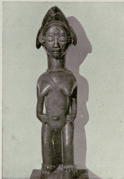
Figura femenina m'pongwé (Gabón). Madera dura, patina muy clara, altura 60 cms. COLECCION VILLE-FABRA, París.

Aspecto importante son las máscaras de danza. Bailar con caretas del mayor o menor promiscuidad