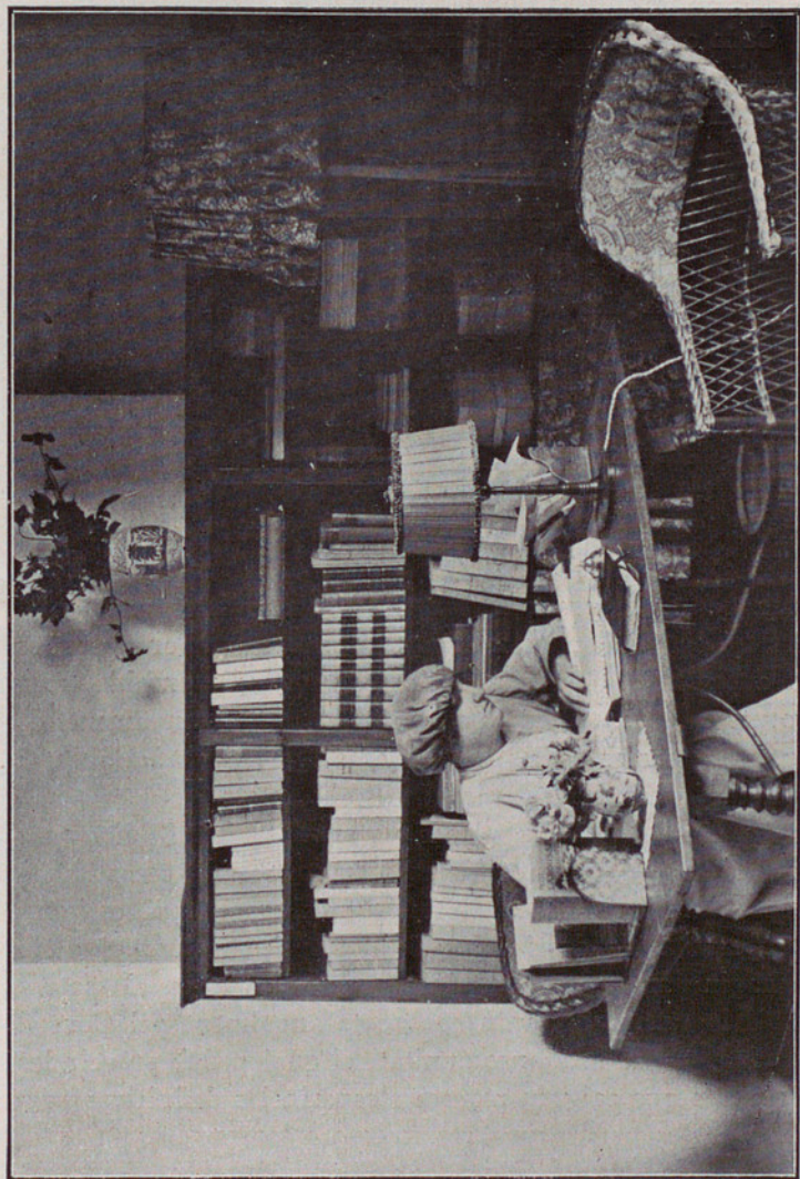
BIBLIOTECA POPULAR DE OLOT : DESPATX DE LA DIRECTORA