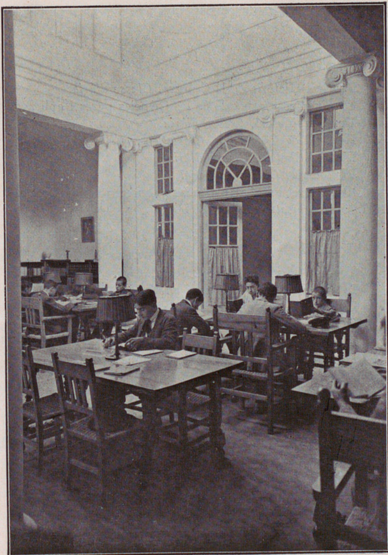
BIBLIOTECA POPULAR DE VALLS : SALA DE LECTURA