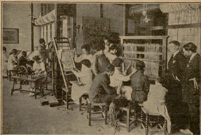
Classe de realitzacions manuals: Teixits. — Any 1919