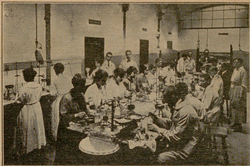
Classe de Química elemental. — Any 1919