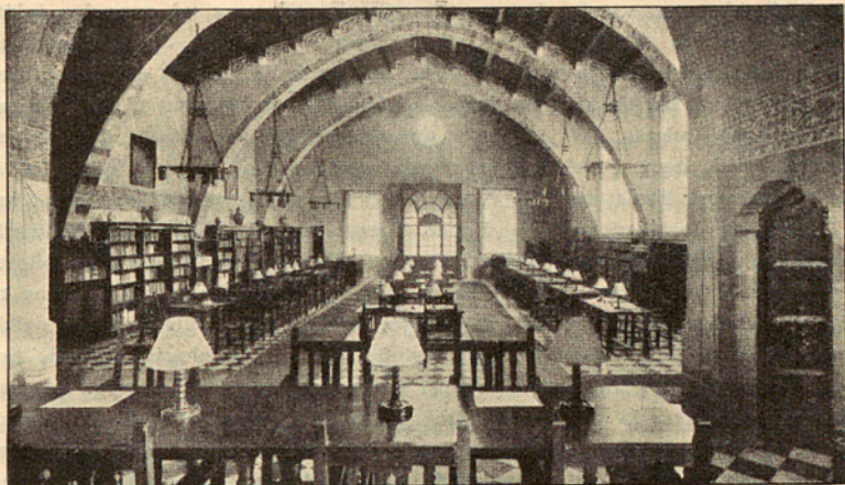
Læsesealen i Folkebiblioteket i Granollers (N. for Barcelona, 26.000 Indb.).

Erstatning for bortkommen Bog kan betales i Afdrag. De ny erhvervede Bøger sendes (tildels efter Ønskeseddel) fra Fælledirektionen, imødeset med Spænding, og opstilles foreløbig i et særligt Nyhedsskab, ligesom Aviserne faar Meddelelse om dem. Desinfektion foregaar ved, at Bøgerne fremlægges i Solen, men et Apparat ønskes meget. Biblioteksførere ( Guías ) udarbejdes af Direktionen og uddeles forskelligt til de forskellige Biblioteker, en hver Maaned eller 6—8 om Aaret, navnlig for at bringe fjerntboende i Kontakt med Bibliotekets kulturelle Atmosfære, hedder det i en Beretning. Det synes at jvære Bibliografier snarere end Kataloger, saaledes faar Manresa 1930 til Udlevering: »Nogle Værker af Interesse for dem, der forbereder sig til Lærergerning«, »Helgeners Liv og Legender«, »Bøger om Leg og Sport«, »Romantismen«, »Nylig modtagne franske Romaner«, »Handelen og alt hvad dermed staar i Forbindelse«, »Juletid«. Til Canet leveres 1929 bl. a. »Arabisk Bibliografi«, »Religiøs Musik«, »Moderne spanske Digtere«, »Sprog«, »Værker for det kvindelige Publikum og særlig vedrørende Familien«, »Rejsebøger«, »Apologetiske Skrifter«; til Granollers bl. a. »Værker om det romerske Spørgsmaal i Anledning af Laterantractaten«, »Antropologi og Præhistorie«. Andre faar dem et andet Aar.