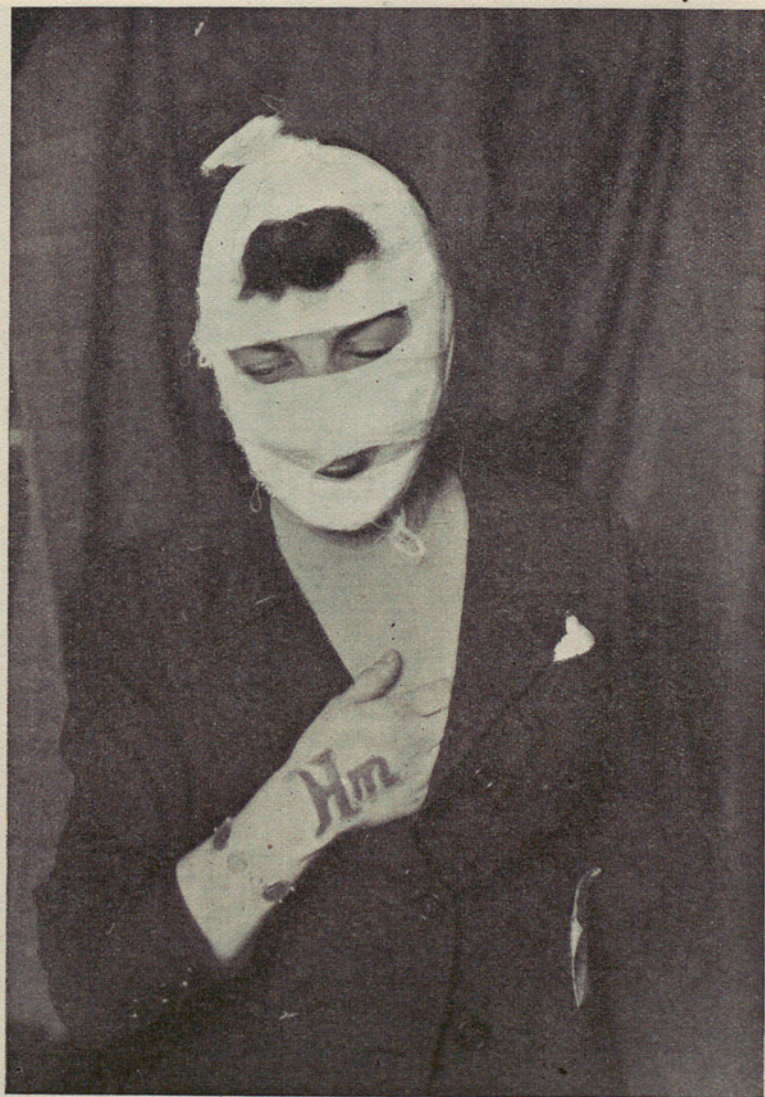
H. m. Heridas de metralla. (Cura antiséptica provisional al ser recogida por la Brigada.)