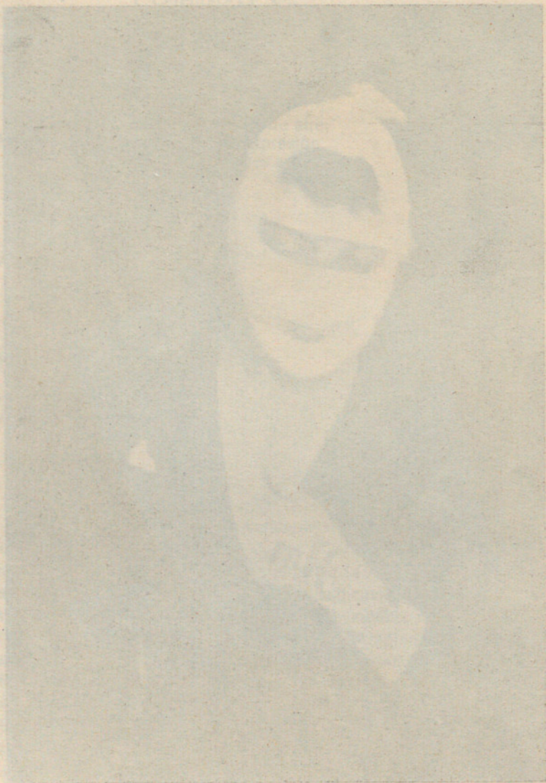
El Sr. Ferrer de Nadal. (Una fotografia provisional al ser recollida per la botiga.)