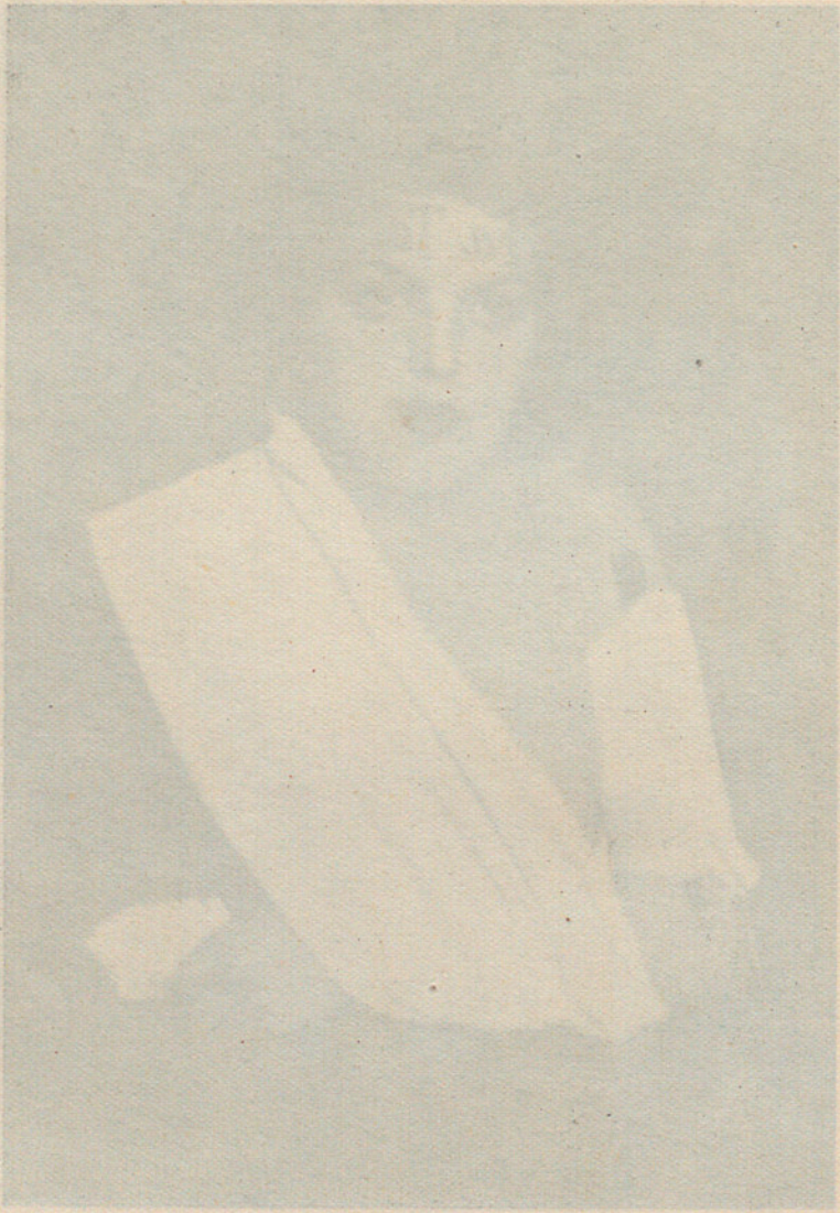
Fig. 2 - Fracción alcohólica. (Caso provisional sobre el terreno). Fig. 3 - Se le ha injertado sobre anfitrión y alcohólico.