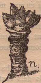
(Figura 2) Ramell

trem acaba amb un ull de fusta. 3. r Ramell . Aquest no produeix més que fruit ; té de 1 a 2 centímetres de llarg i acaba amb un ull de fusta que a penes es desenrotlla i que està rodejat de 3 a 7 borrons florals ; sol estar situat a la brotada de dos anys ; és el gran productor d'ametlles i els francesos en diuen Bouquet de mai . 4. t Brot borronat que es distingeix de l'anterior perquè és més llarg i no acaba amb una corona de botons florals sinó que els té repartits, en tota la seva llargada que és de 5 a 15 centímetres ; no