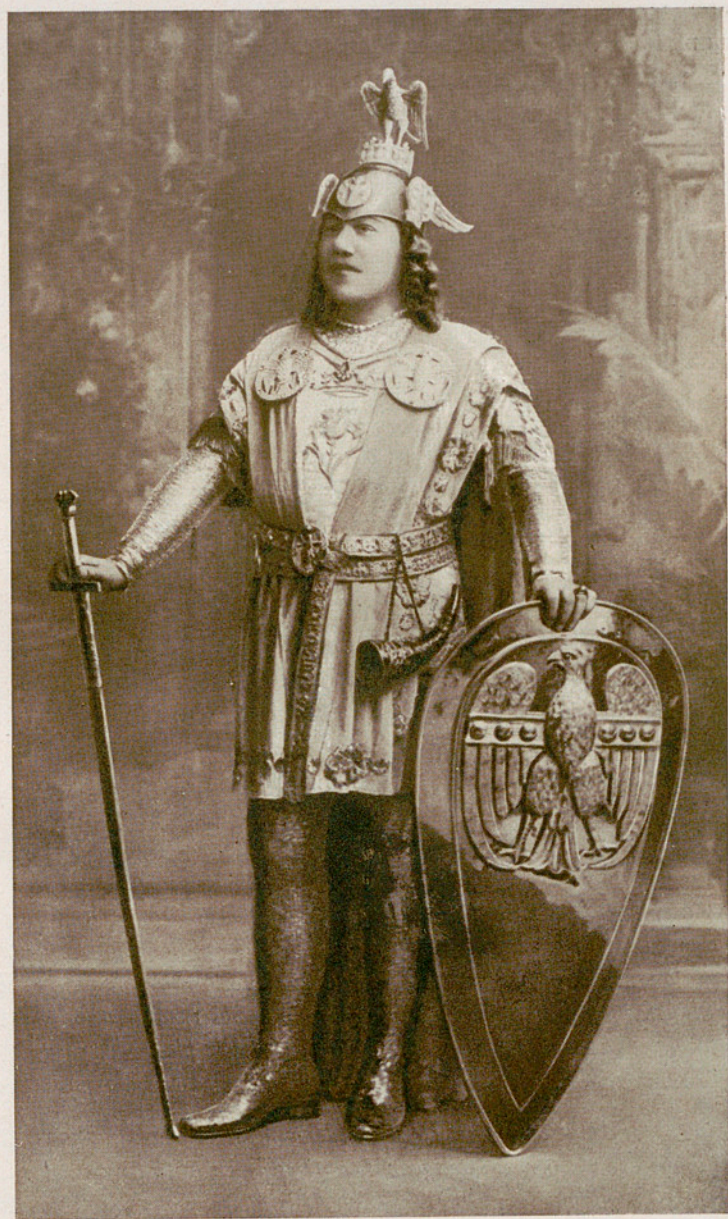
FRANCISCO VIÑAS en "LOHENGRIN" en 1901