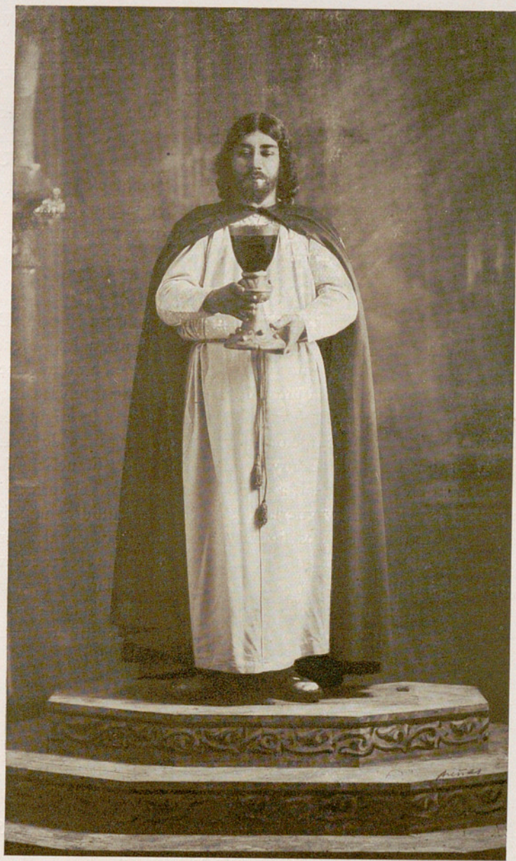
FRANCISCO VIÑAS en "PARSIFAL" en 1914