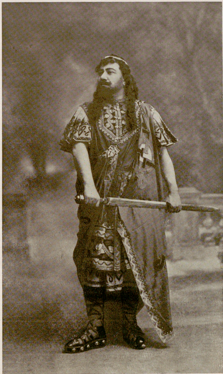
FRANCISCO VIÑAS en "TRISTAN E ISOLDA" en 1907