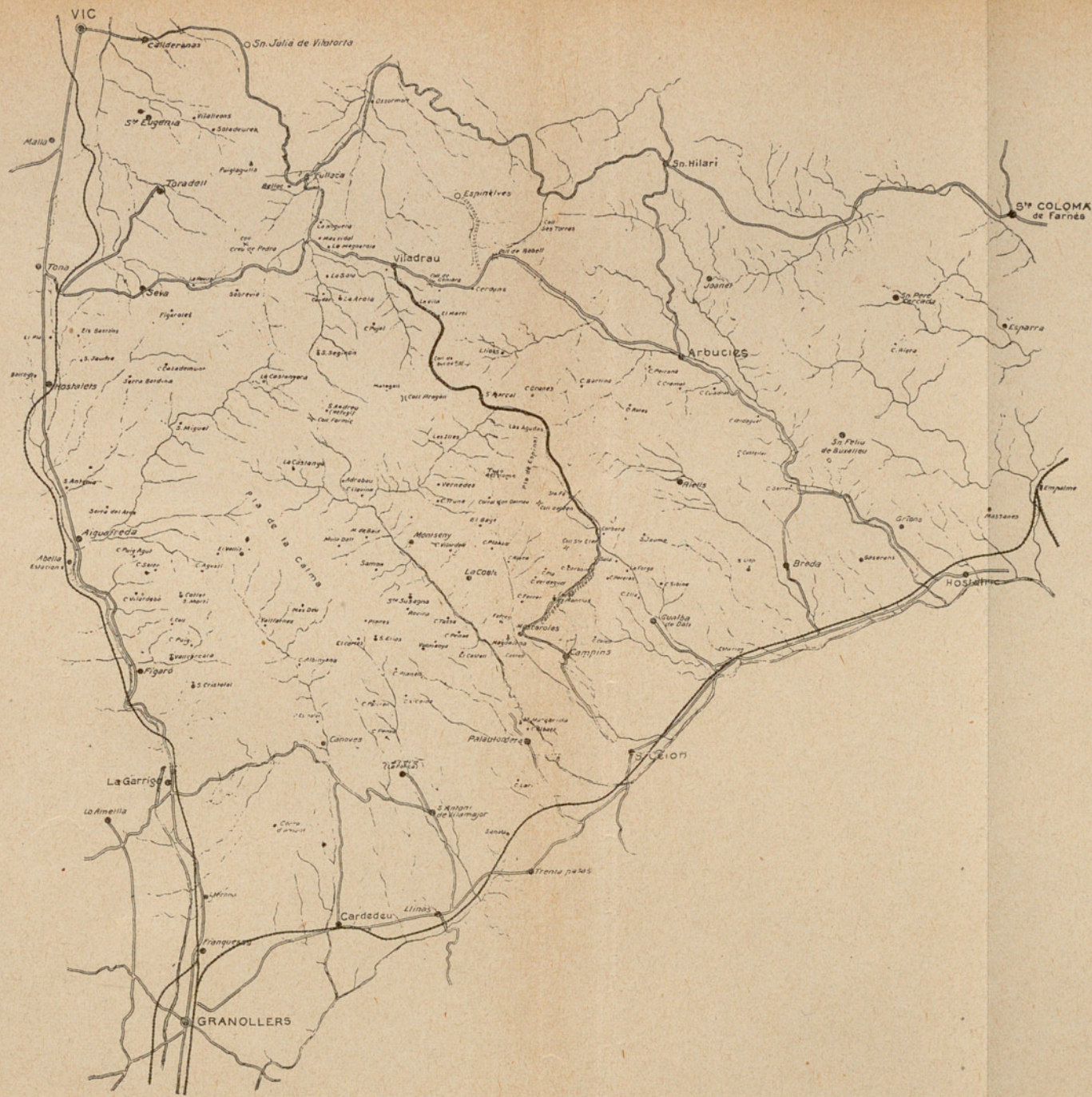
CAMÍ DE FERRADURA N.º 15, DEL PROJECTE D'ACORD PRESENTAT A L'ASSEMBLEA