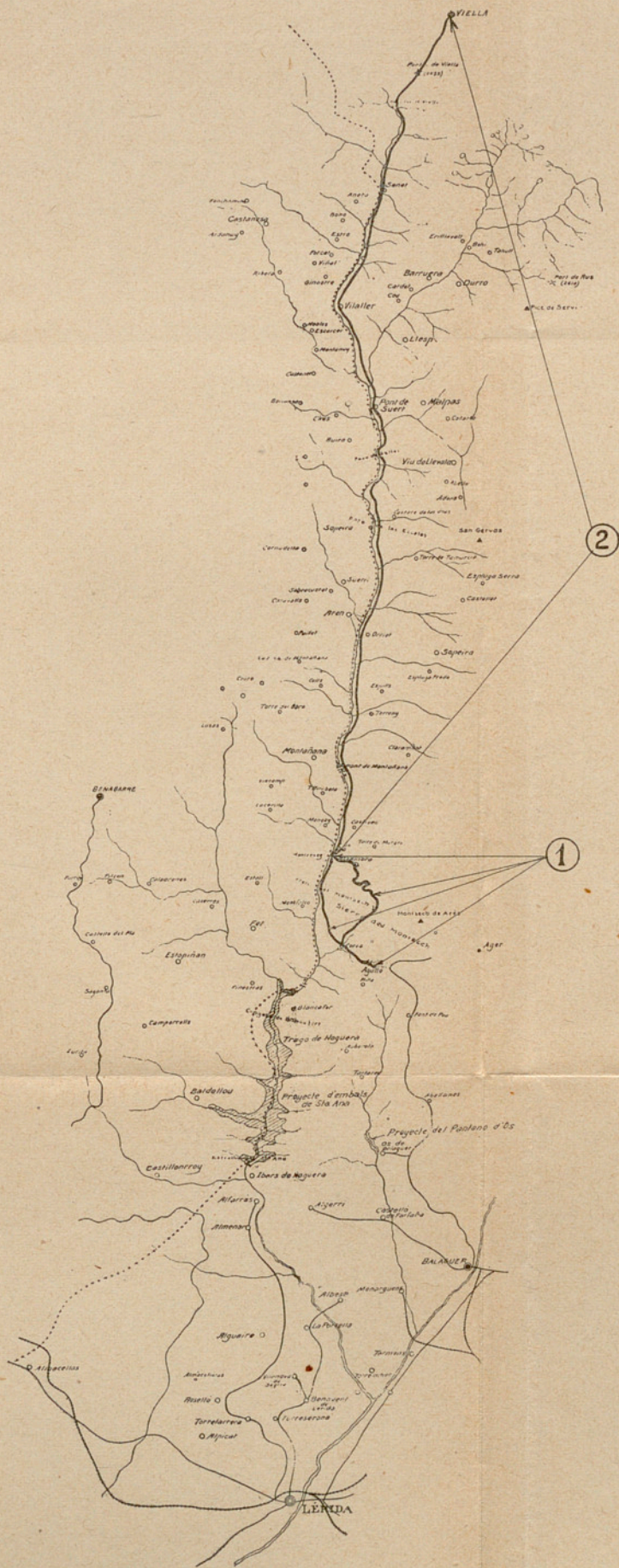
CAMINS DE FERRADURA N.ºS 1 I 2 DEL PROJECTE D'ACORD PRESENTAT A L'ASSEMBLEA