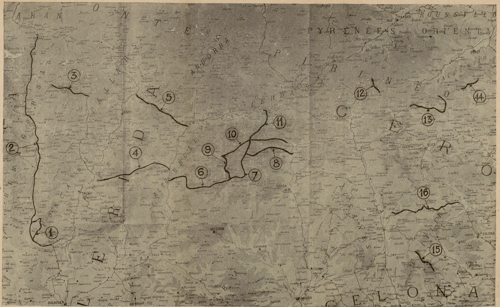
CAMINS DE FERRADURA COMPRESOS EN EL PROJECTE D'ACORD PRESENTAT A L'ASSEMBLEA