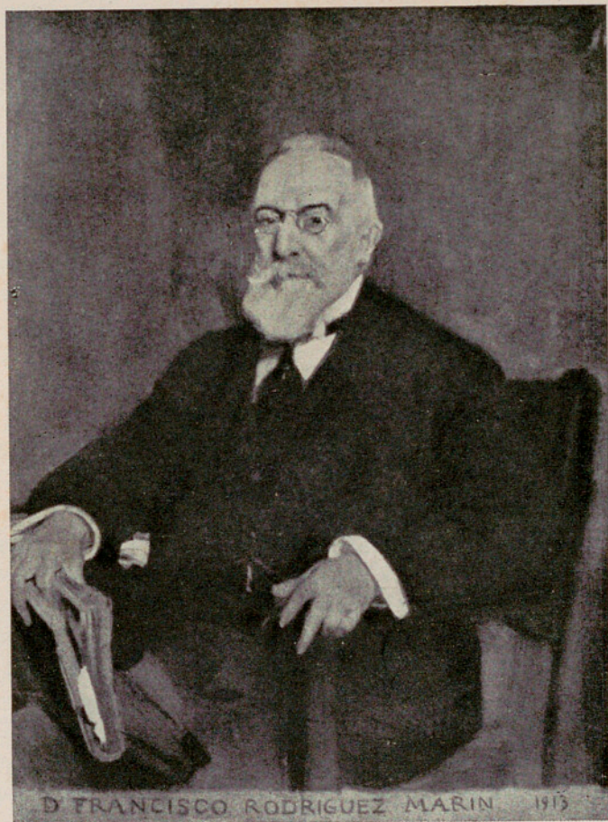
Cuadro de don Joaquín Sorolla, existente en The Hispanic Society of America (Nueva York)