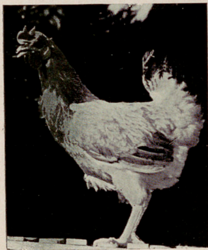
Gallina n.º 104 Prat leonada, 230 puntos, Fco. Vega de Bornos (Cádiz)