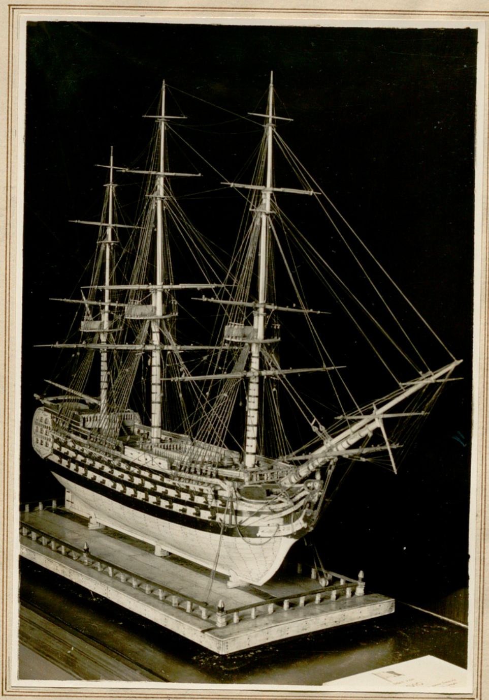
Modelo de navío de tres puentes de la segunda mitad del siglo XVII cons- truido en marfil y carey adquirido por el Museo Marítimo.