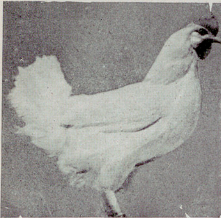
← Primer premio. — Copa de Campeonato de la Excm. Diputación Provincial de Barcelona. Gallina n.º 14. Raza Leghorn blanca. Puntos, 266; huevos, 259; peso, 15,105 g. Presentada por la Granja Ilerda, de la Excm. Diputación Provincial de Lérida.