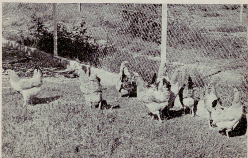
Lote n.º 24. — Raza Prat leonada. Ganador de la Copa de la Cámara Oficial Agrícola de Barcelona. Presentado por la Colonia Agrícola Torrebonica, de la Caja de Ahorros y Pensiones para la Vejez de Barcelona. Puntos, 1452'45; huevos, 1377; peso, 83,537 g.