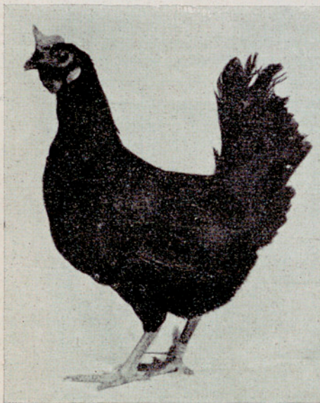
Gallina n.º 82. — Raza Castellana negra. Presentada por la Granja Paraíso, de Arenys de Mar. Puntos, 236'75; huevos, 225; peso, 13,379 g.