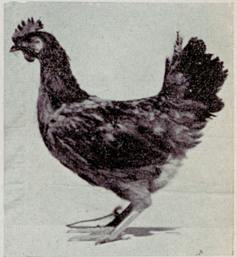
Gallina n.º 247. — Raza Prat Leonada. Presentada por Colonia Agrícola Torrebónica, de Tarrasa. Ganadora de la Copa de la Cámara Oficial Agrícola de Barcelona. Puntos, 260'55; huevos, 235; peso, 14,543 g.