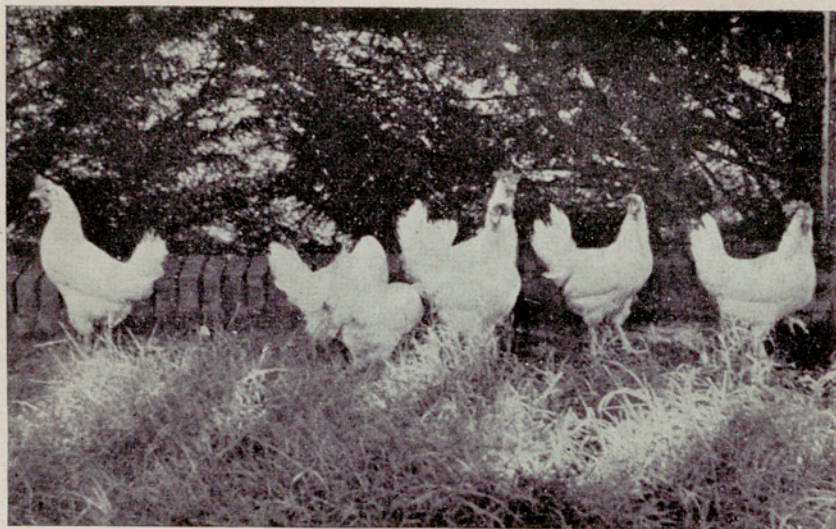
Lote n.º 1. — Raza Leghorn blanca. Ganador de la Copa de Campeonato de la Excm. Diputación Provincial de Barcelona. Presentado por la Granja Herda, de la Excm. Diputación de Lérida. Puntos, 1542'25; huevos, 1538; peso, 89,137 g.