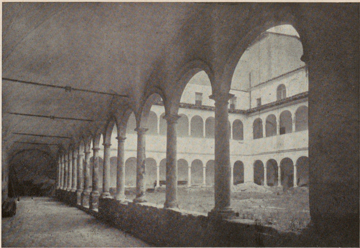
Edifici en hi ha instal·lada l'Escola Superior de Paisatge d'Olot.