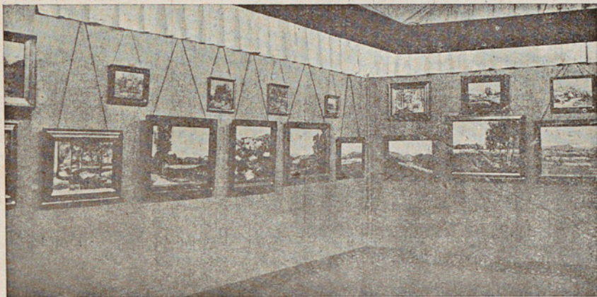
Treballs presentats en la 1. a Exposició dels Alumnes de l'Escola Superior de Paisatge