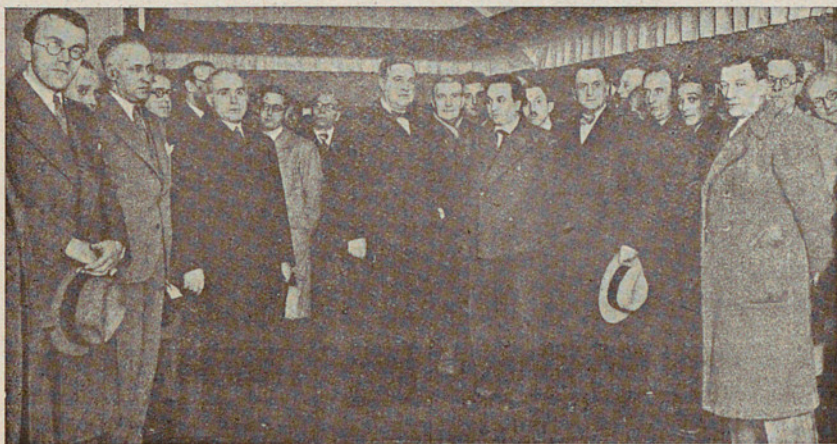
Assistents a l'acte de la Inauguració de la 1. a Exposició dels Alumnes de l'Escola Superior de Paisatge.

En la Escuela de Olot profesan en cursos que se suceden con regularidad y que se renuevan totalmente, algunos de nuestros mejores artistas. Ivo