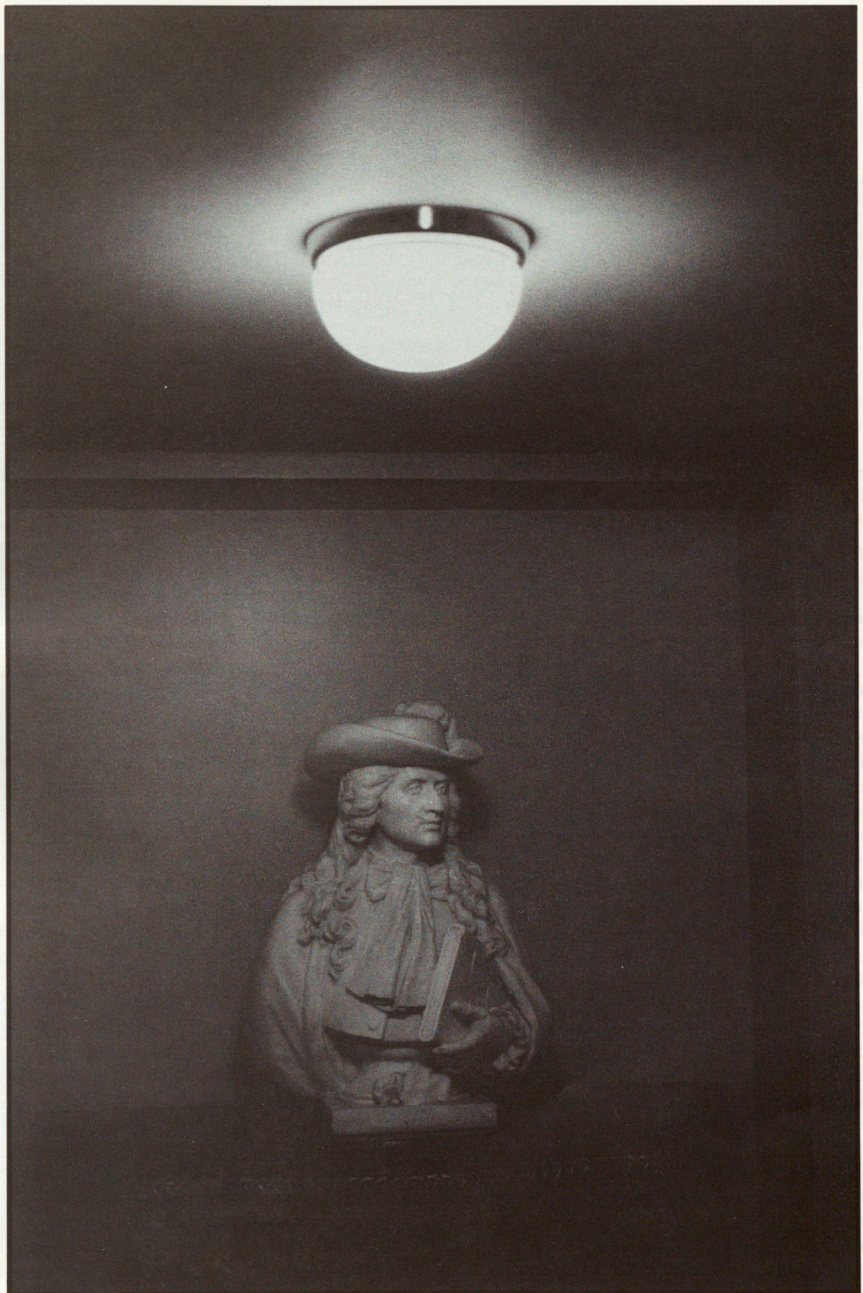
PARIS, LA COMEDIE, 1977