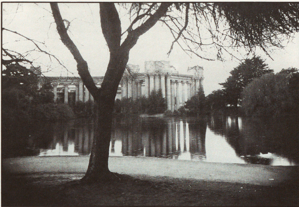
SAN FRANCISCO, USA. 1980