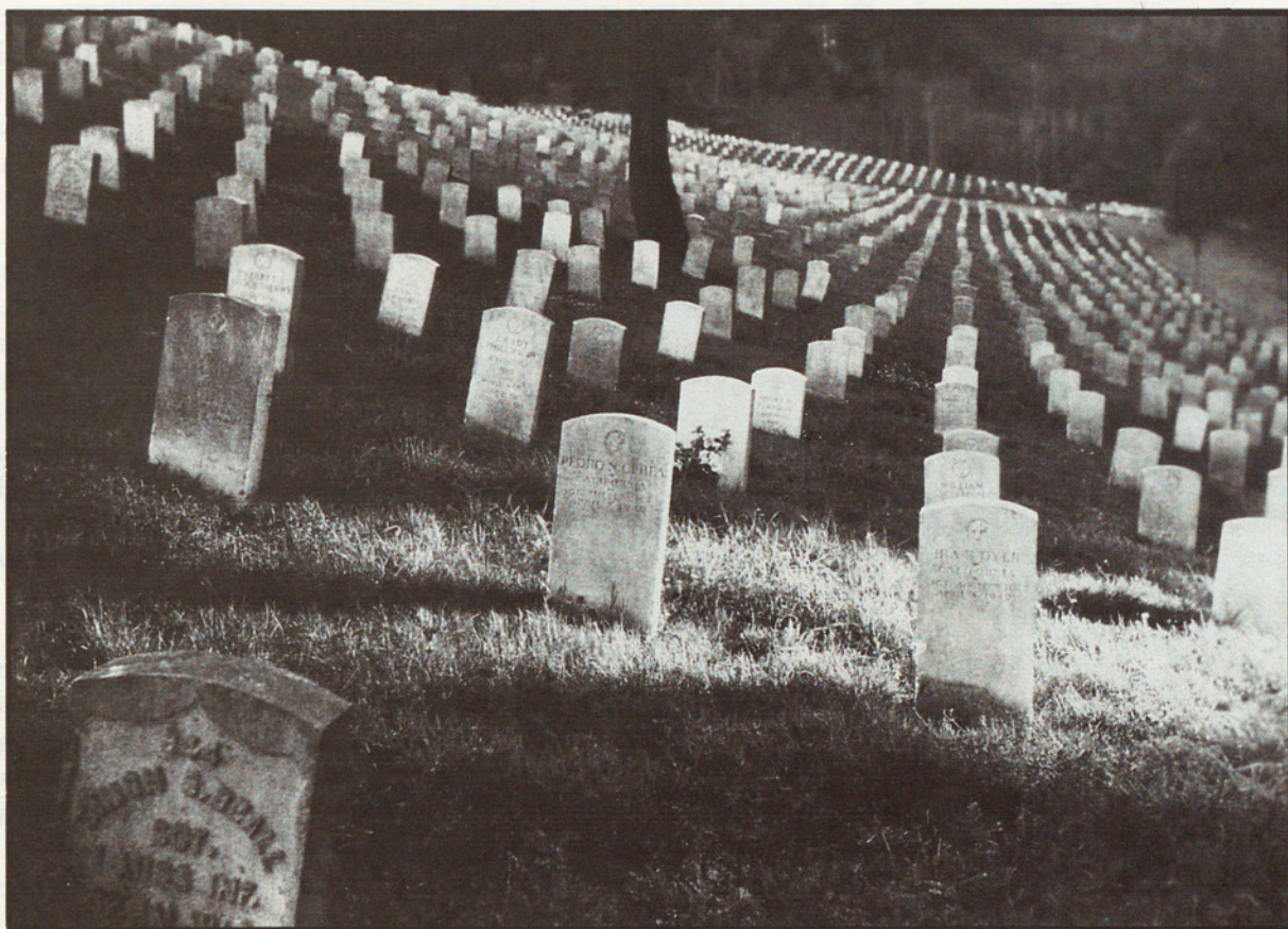
CEMENTIRI SAN FRANCISCO, USA. CALOTIP. 1980