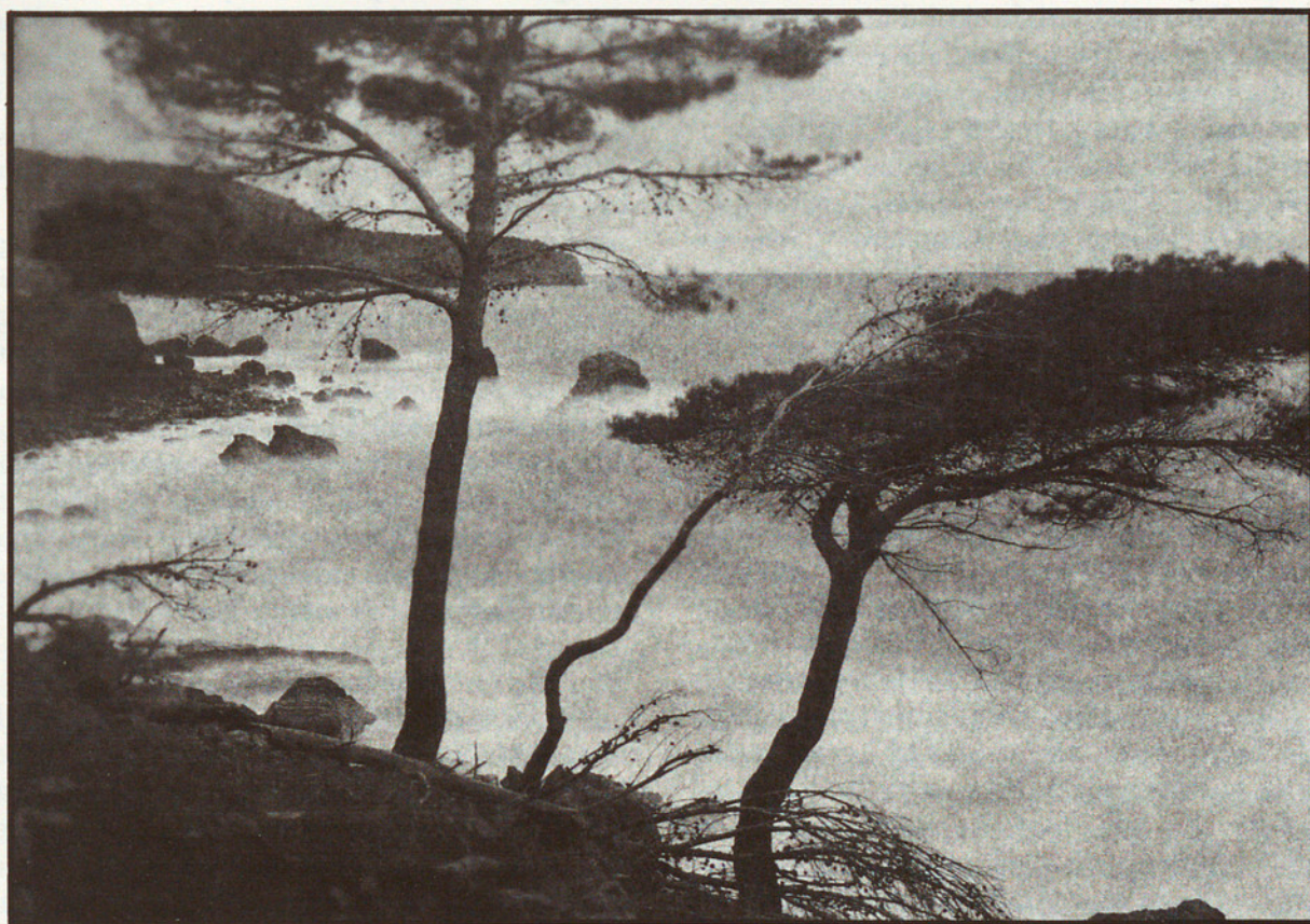
LLUC ALCARI (MALLORCA). CALOTIP. 1979