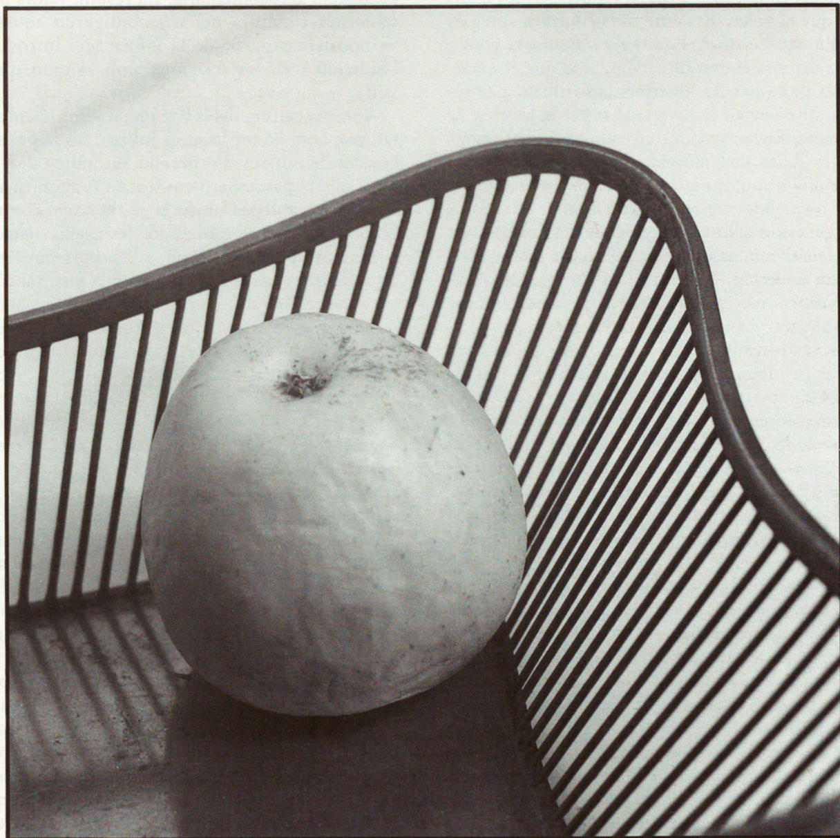
LA POMA. NOVEMBRE 1979