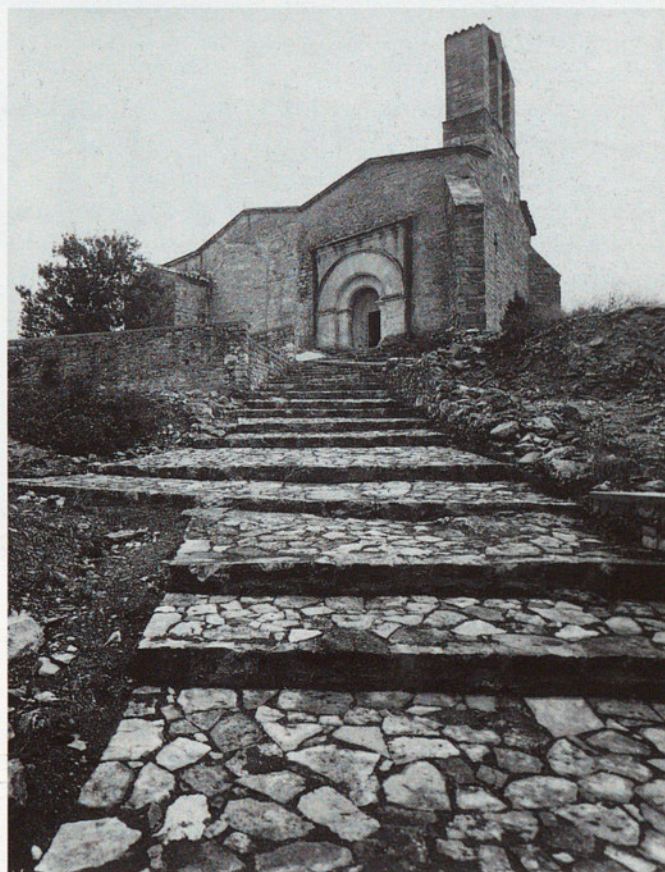
SANT PERE DE VILADEMÀGER. LA LLACUNA. ENDEGAMENT DE L'ENTORN.

l'església fa més de deu anys pel servei de la Diputació, i estendre-la ara a les restes de les fortificacions i a d'altres edificis del seu entorn.