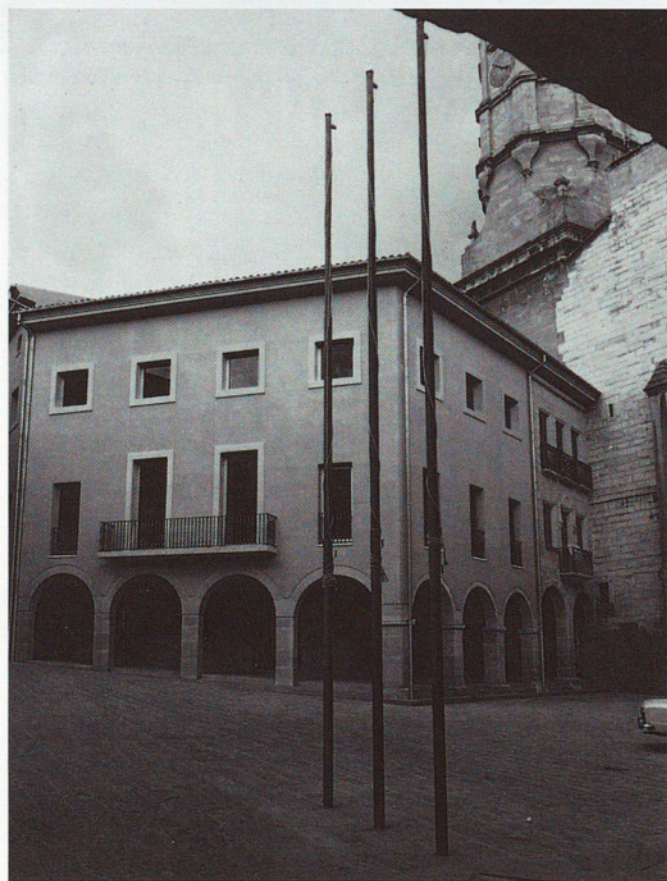
PLAÇA GRAN DE CALAF

L'actuació de l'administració pública en l'agencament i revaloració dels espais urbans i d'aquells elements constructius que formalitzen aquests espais, com poden ser les façanes o els elements col·lectius i singulars dels edificis que els envolten, cada vegada és més freqüent.