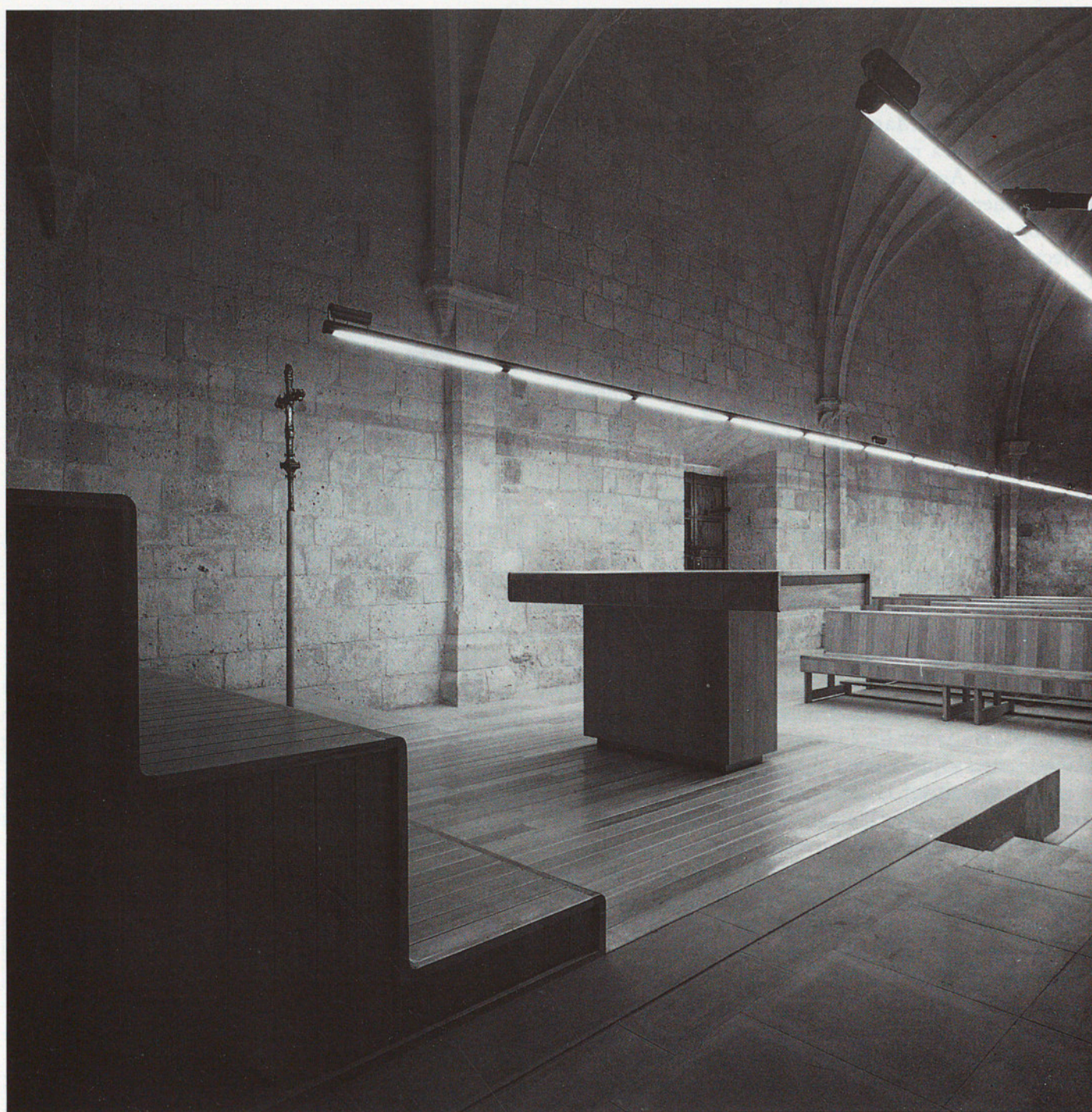
ESGLÉSIA DE SANTA CÀNDIA D'ORPÍ. PRESBITERI

explicat. En el coneixement de l'edifici van col·laborar diversos tècnics i historiadors del servei de la Diputació. Es va fer un estudi documental exhaustiu i diversos estudis comparats i treballs monogràfics sobre aspectes ornamentals, estilístics, iconogràfics i hagiogràfics.