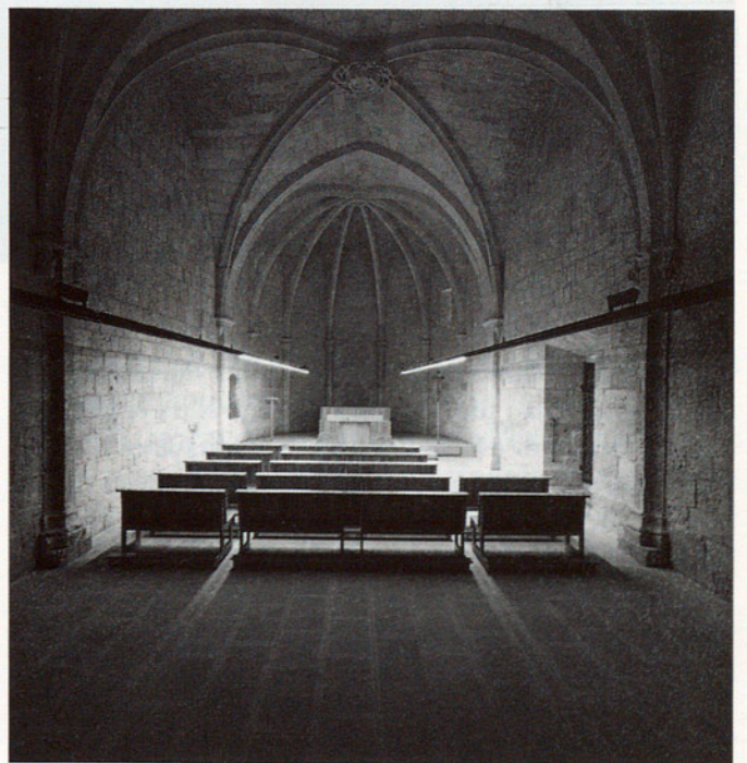
ESGLÉSIA DE SANTA CÀNDIA D'ORPÍ. NAU.