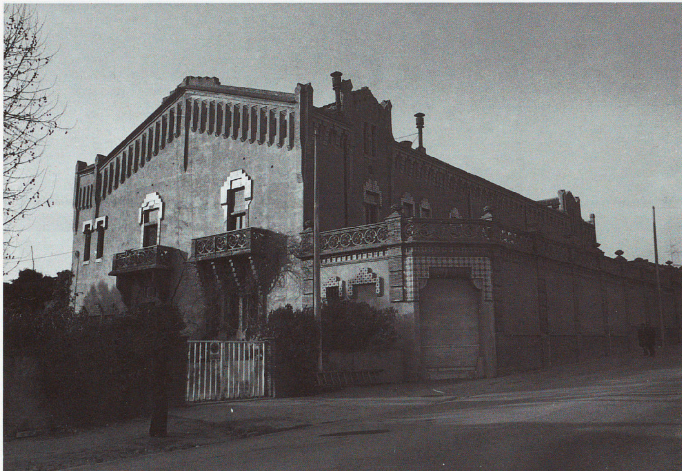
CAN CASES. EL BRUC

L'Ajuntament del Bruc va tenir prou sensibilitat per adonar-se d'aquestes potencialitats de l'edifici i va engegar una actuació que permetés treure'n el màxim profit col·lectiu possible. No era fàcil per a un municipi de pocs habitants aconseguir la titularitat d'un patrimoni particular tan important. La imaginació a l'hora d'aprofitar tots els recursos de la legislació urbanística i la col·laboració de les institucions de caire supramunicipal permetran que aviat l'edifici projectat ara fa un segle per l'arquitecte Cristóbal Cascante, transformat en Casa de la Vila i dependències culturals, afegeixi la representativitat administrativa, política i cultural a la que ja té des d'un punt de vista arquitectònic.