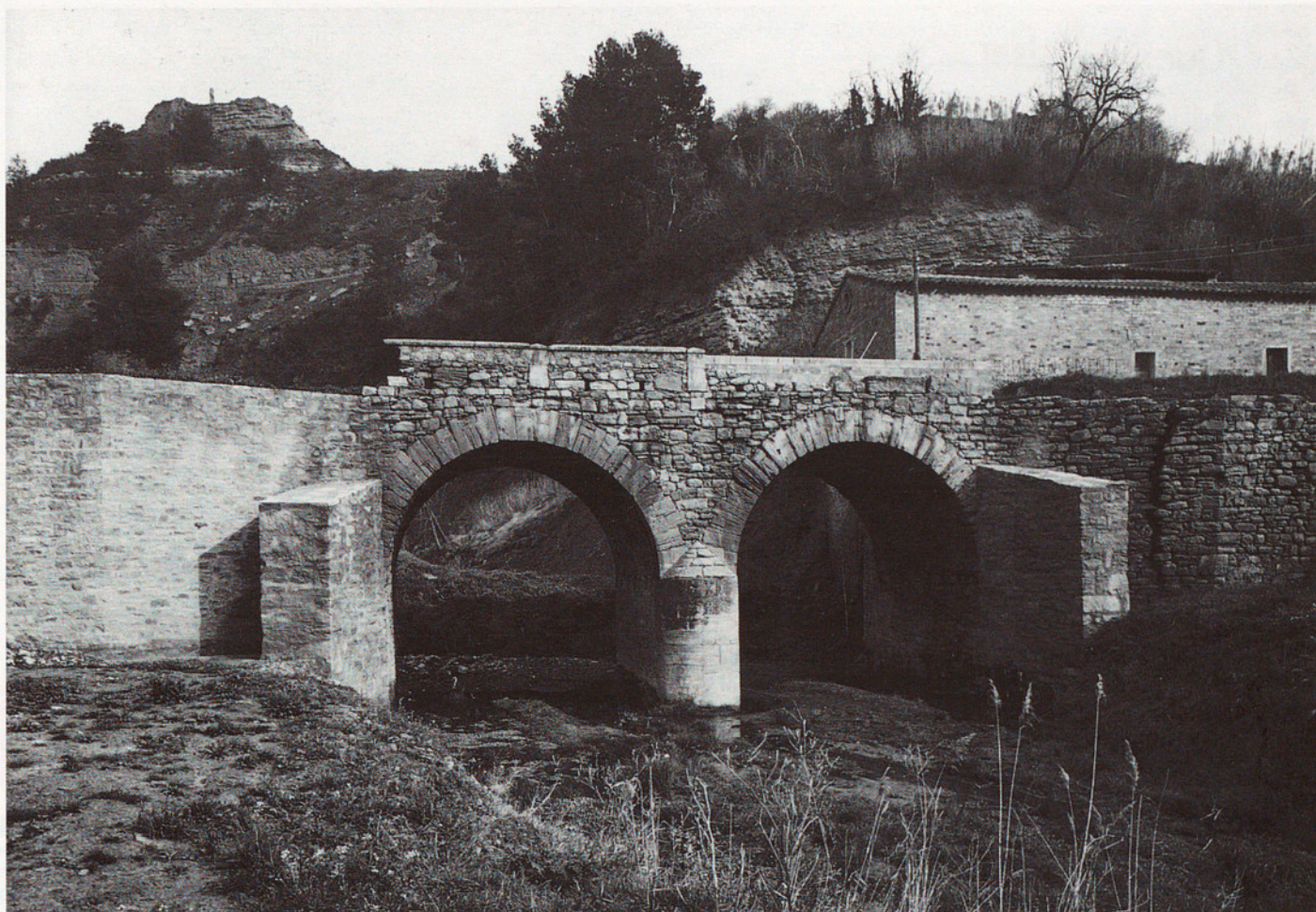
PONT SOBRE LA RIERA DE RUBIÓ. JORBA

L'espai urbà té un caràcter utilitari, representatiu i de relació de gran importància, la qual cosa fa que la seva revaloració tingui avui gairebé tanta importància com l'actuació en els monuments. Hem de ser conscients, però, que limitacions de tipus pressupostari i legal fan impossible plantejar aquestes actuacions amb la profunditat que seria de desitjar; (rehabilitació i millora dels habitatges i equipaments situats en aquests edificis, etc.). El fet d'actuar a l'espai urbà és prou important en si mateix pels valors de l'espai que abans assenyalava i per la repercussió indirecta que aquesta revaloració pot tenir en el conjunt del patrimoni edificat de titularitat particular. L'actuació a la plaça Gran de Calaf és un exemple d'actuació correcta des del punt de vista del disseny, que fuig dels criteris costumistes i populistes que sovint han presidit aquest tipus d'actuació als centres històrics.