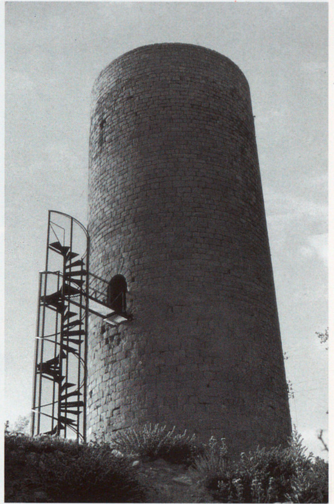
TORRE DE LA MANRESANA A ELS PRATS DE REI

L'actuació a Santa Càndia, projectada abans que acabés l'obra de la Manresana, ja suposa un exemple de l'aplicació total del procés metodològic que hem