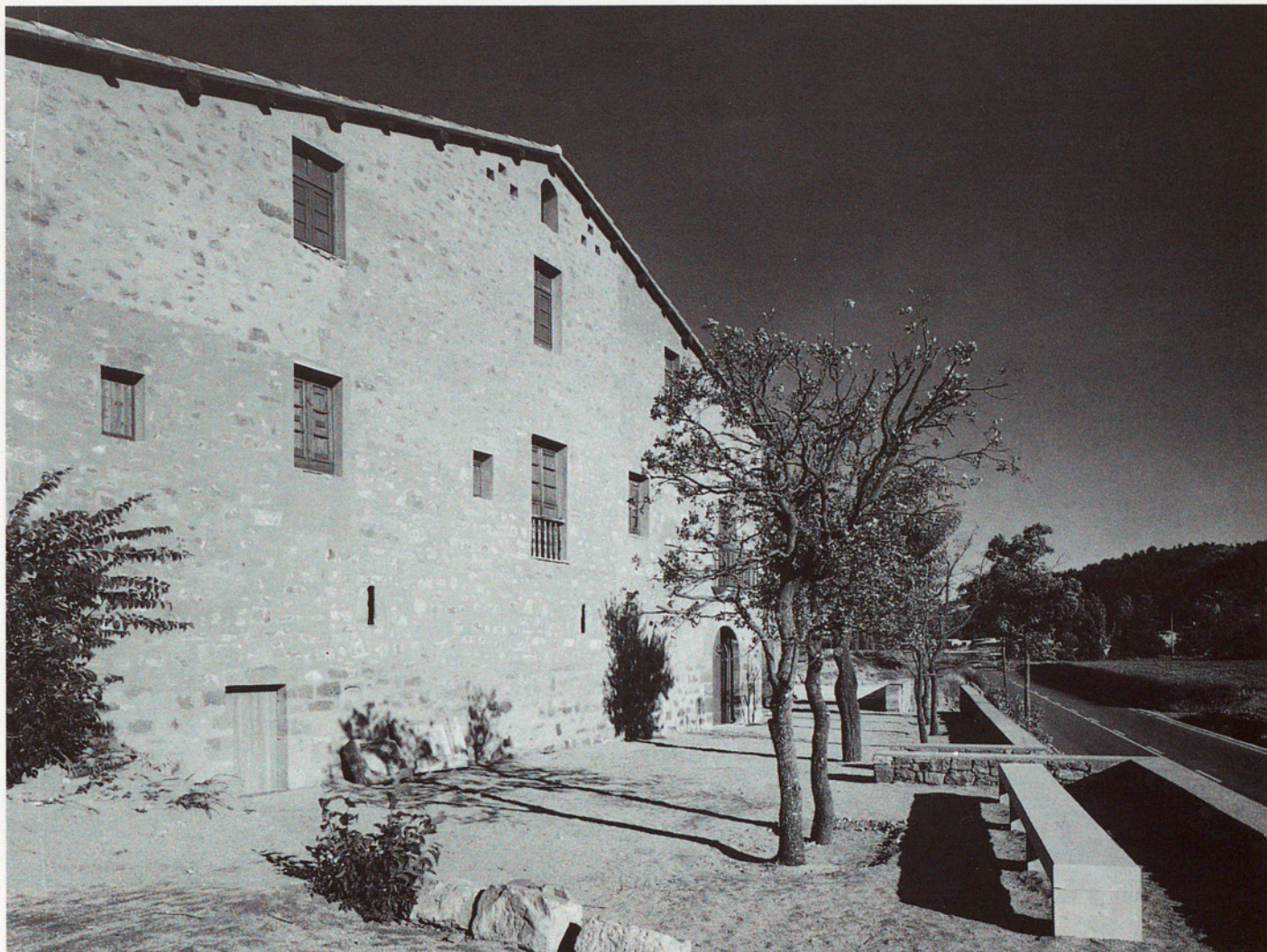
PRIORAT DE SANTA MARIA DE CASTELLFOLLIT DE RIUBREGÓS ADAPTAT PER A CASA DE COLÒNIES