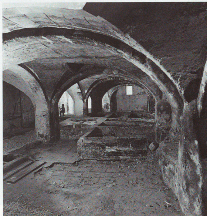
CAL GRANOTES. IGUALADA.

ció o un tipus d'activitat del passat. No ha de confondre's aquesta actuació, ben legítima, amb l'historicisme acrític i acultural que ha presidit les actuacions en el patrimoni durant prop d'un segle.