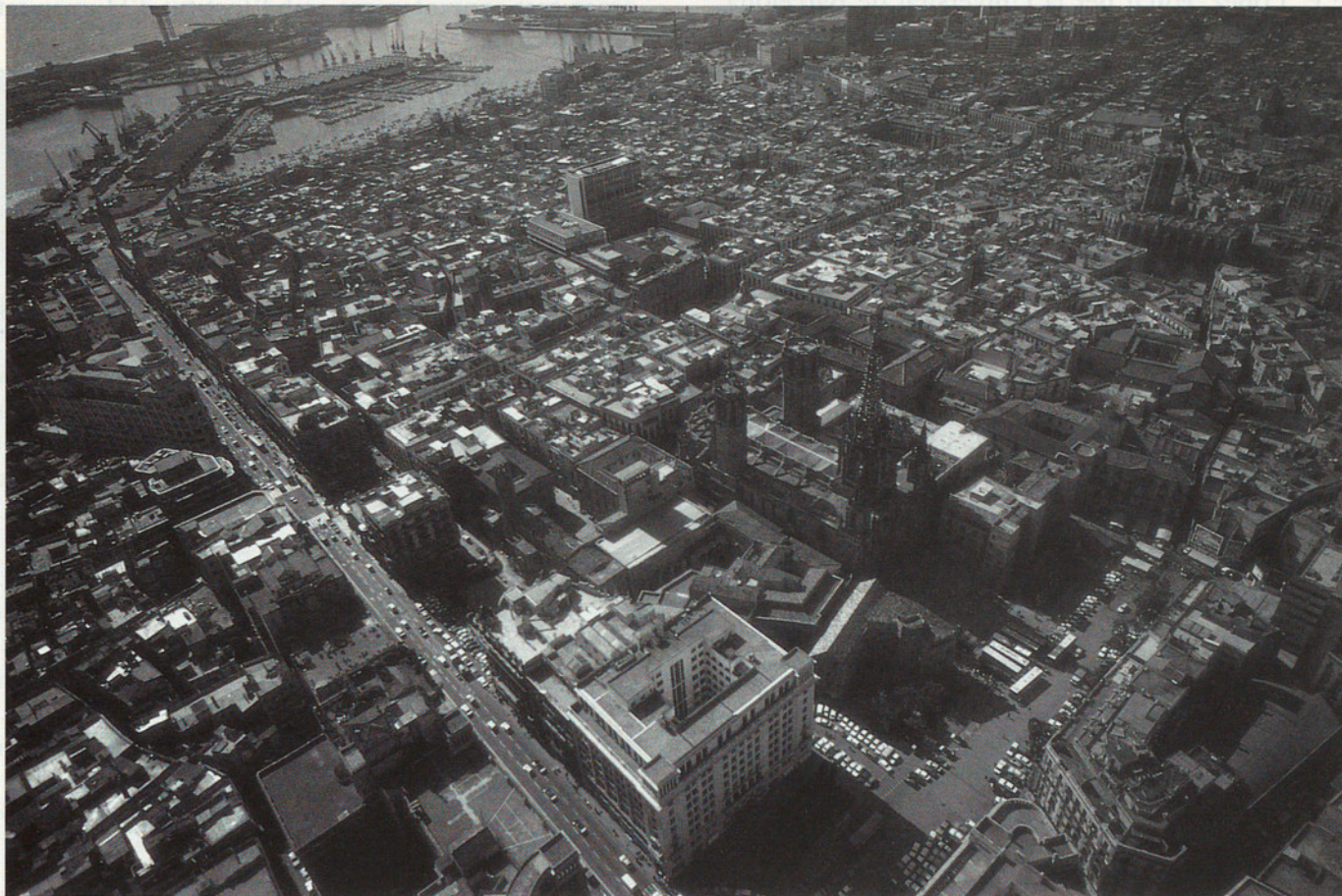
LA CATEDRAL, EL NUCLI ANTIC I EL PORT DE BARCELONA