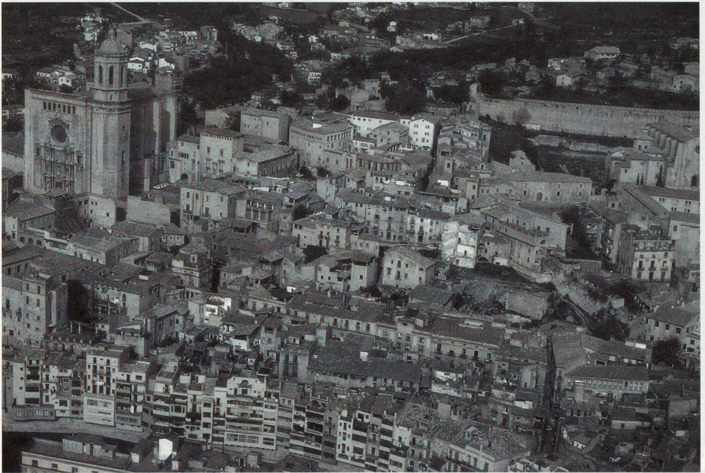
VISTA PARCIAL DEL BARRI VELL I LA CATEDRAL DE GIRONA

freqüentades a l'estiu per forasters desitjosos de conèixer la ciutat i el seu funcionament (Barcelona rep mig milió de turistes l'any), durant la setmana sobre tot per escolars, els caps de setmana per ciutadans en general, i en tot moment per persones especialment interessades en les activitats que es portaran a terme. A aquest efecte s'està en vies de rehabilitar l'antic edifici del carrer de Wellington -edifici de peculiar interès arquitectònic- a fi d'acollir un taller de