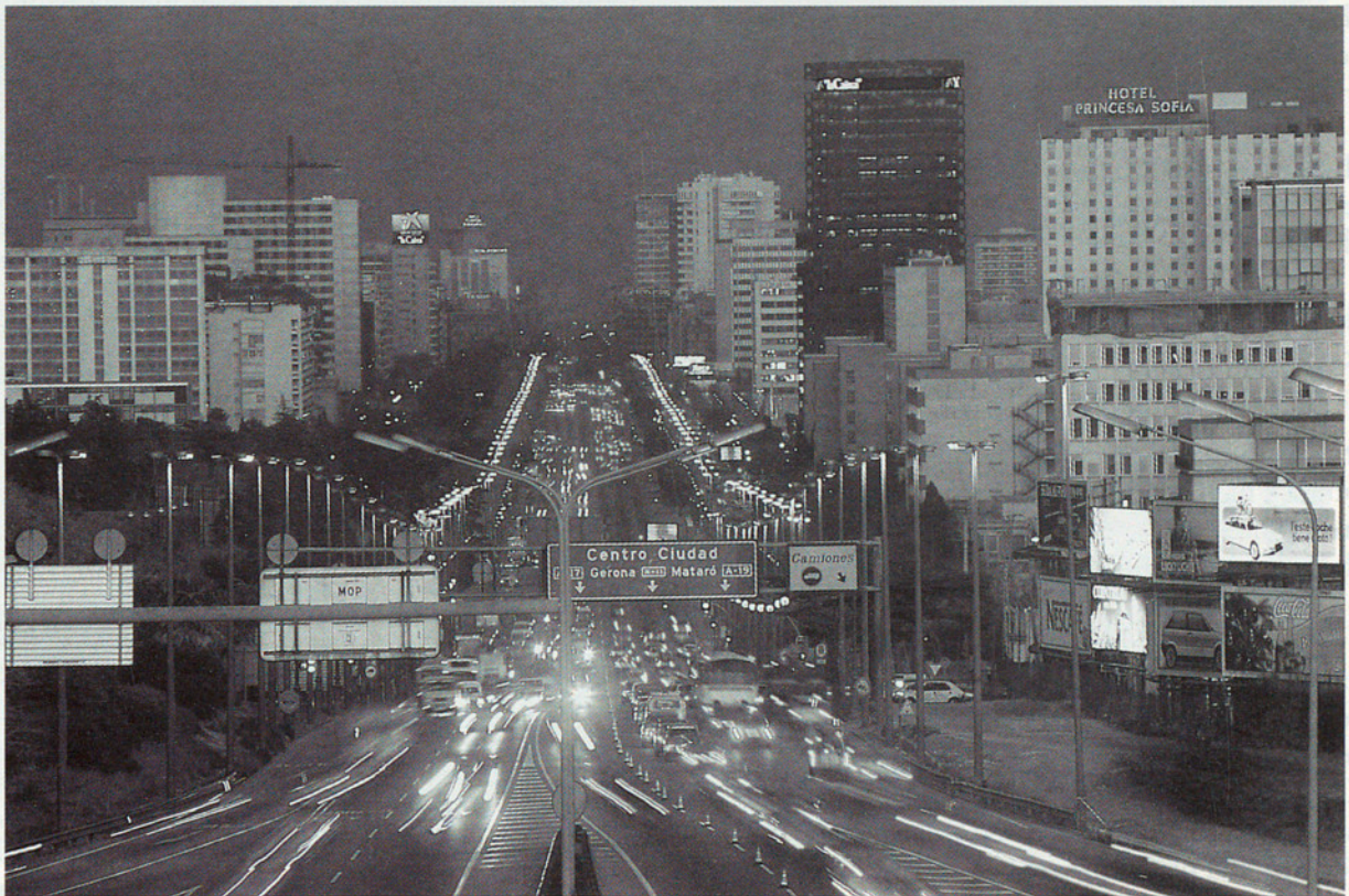
BARCELONA, LA DIAGONAL

El servei de Parcs Naturals de la Diputació de Barcelona, amb la col·laboració de l'INEM ha organitzat un equip tècnic, el qual ha desenvolupat i col·laborat amb els ajuntaments en la redacció dels plans bàsics i de prevenció municipal.