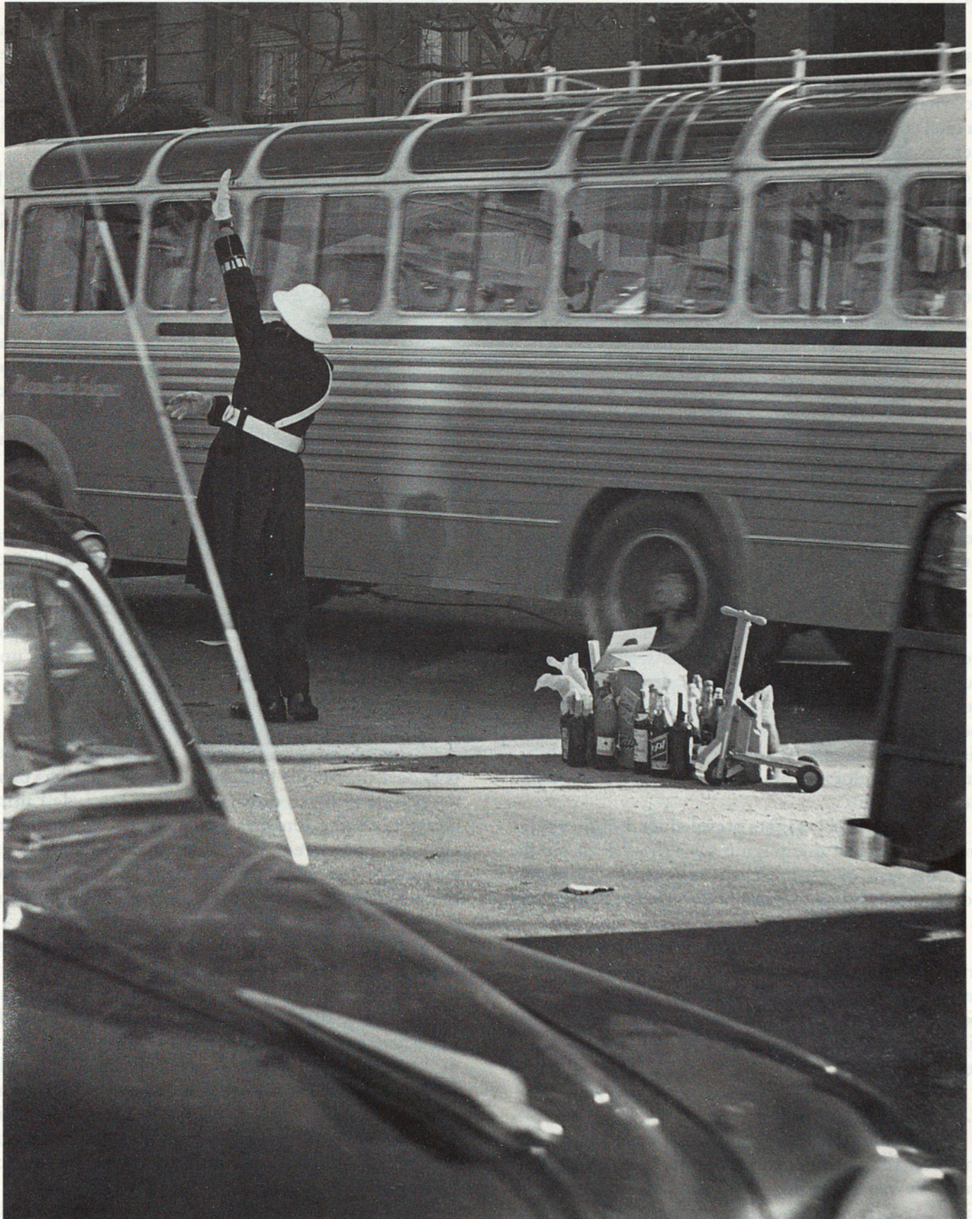
GUARDIA URBANA EN VIGILIES DE NADAL, 1960