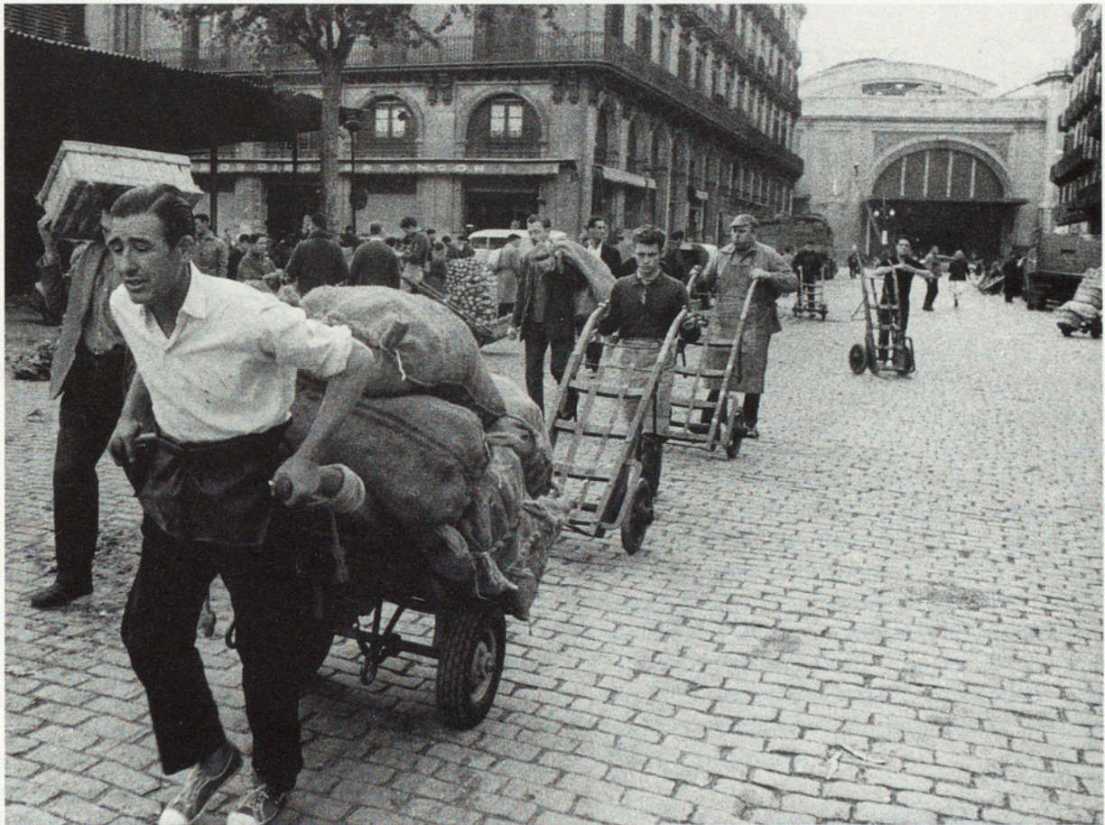
EL BORN, 1962