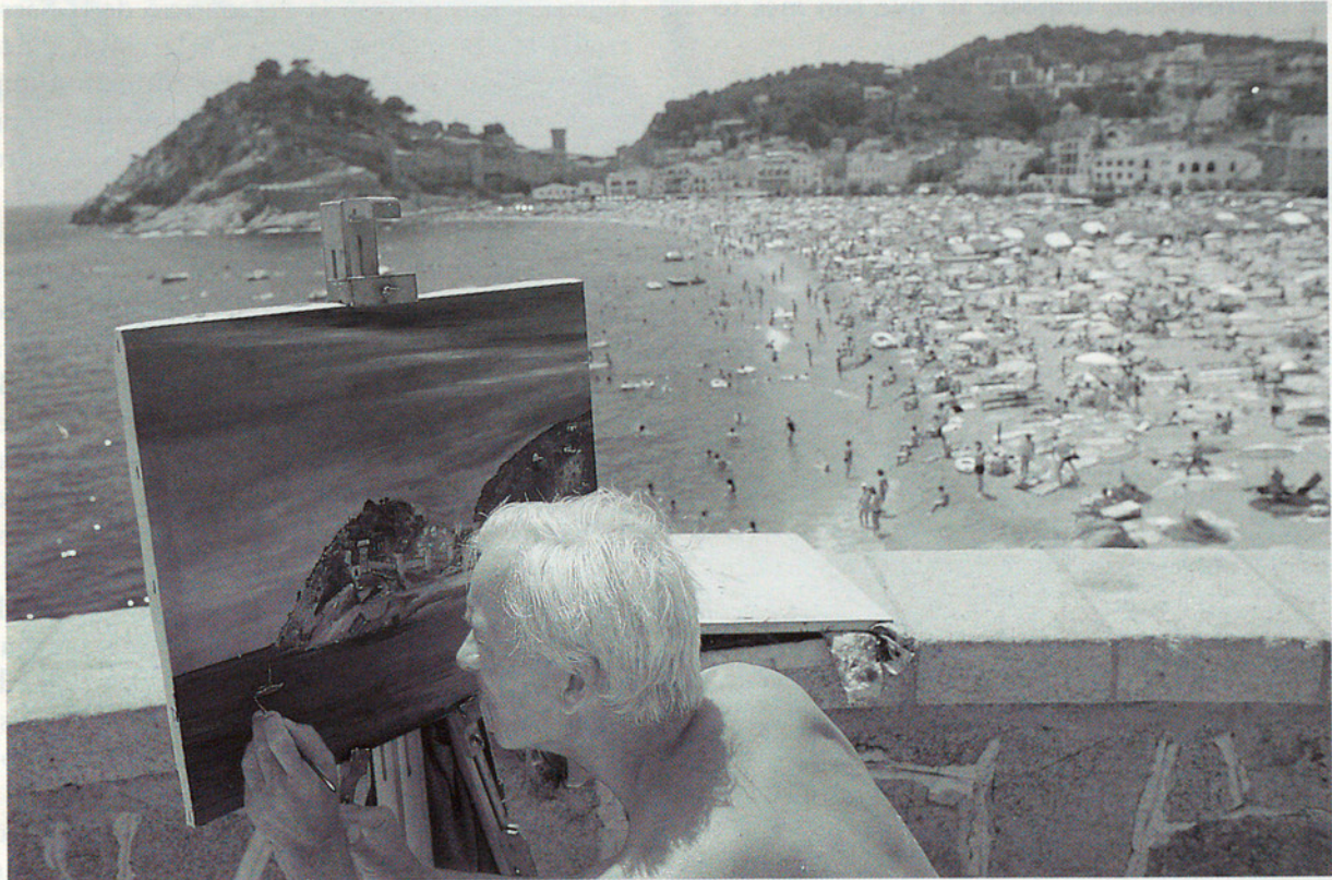
TOSSA, LA SELVA