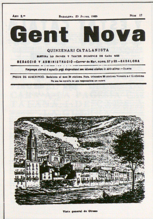
Publicació badalonina (1899)