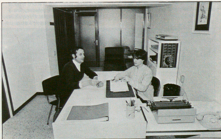
Molta publicitat arriba de forma directa

Les previsions o càlculs econòmics que s'havien realitzat es basaven en una tirada òptima de cinc mil exemplars, i per això es va començar amb tres mil periòdics cada edició. Però el nombre va anar creixent, de manera que, al cap d'un any de presència al carrer, s'assolien els vuit mil exemplars, als dos anys se superaven els deu mil i en complir els tres anys la tirada era de tretze mil.