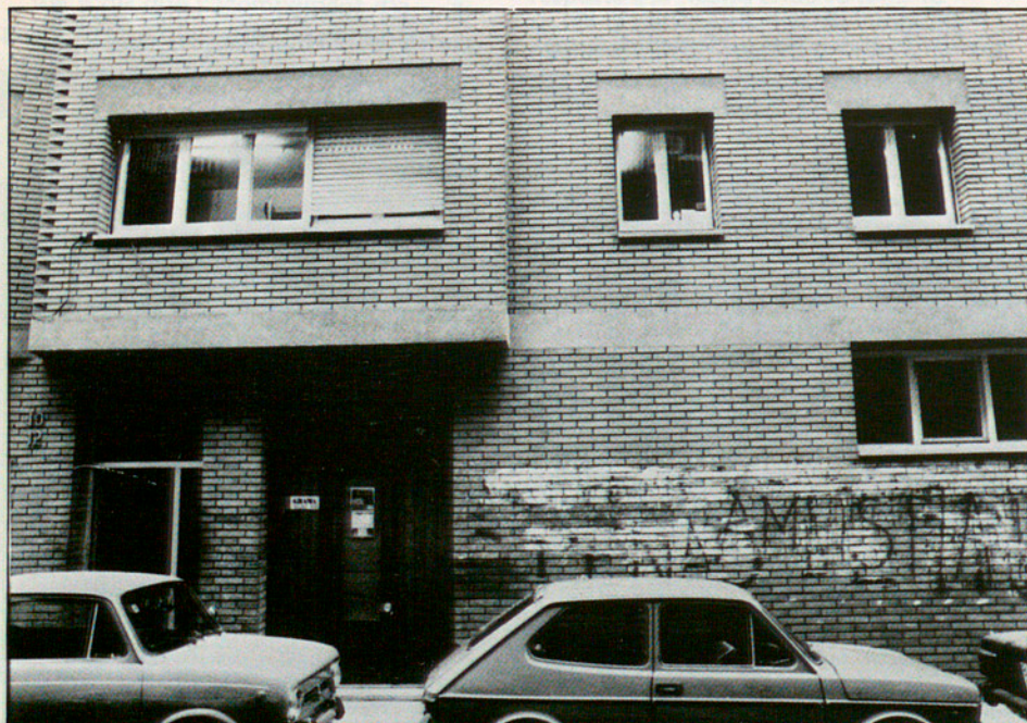
La sede de Grama