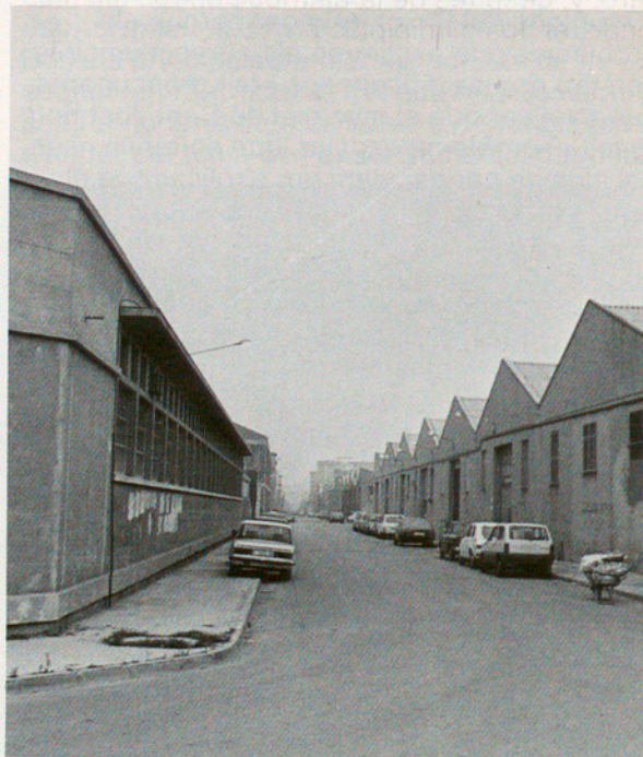
Imatge habitual: naus i magatzems industrials, en aquest cas a Cornellà

Yo pienso que existe, a nivel popular y a nivel político dentro de los hombres que estamos al frente de los pueblos de las comarcas, una voluntad y un sentimiento real de colaboración y por eso pedimos y exigimos una correspondencia similar por parte de los entes que tienen obligación de hacerlo. Es impensable que se efectúe una planificación de servicios de la comarca sin reunir previamente a los alcaldes. Y por esta razón hace falta reforzar políticamente el sentido comarcal; en fin, tener una voz autorizada que pueda presentar los problemas comunes. Porque, vamos a ver, el problema laboral no lo puede solucionar el Gobierno de Catalunya ni el Gobierno autonómico de Euskadi por sí solos, porque es un problema global de Estado, pero en cambio lo que sí puede hacer el Gobierno de Catalunya es convocar a los responsables de cada municipio. Porque, como