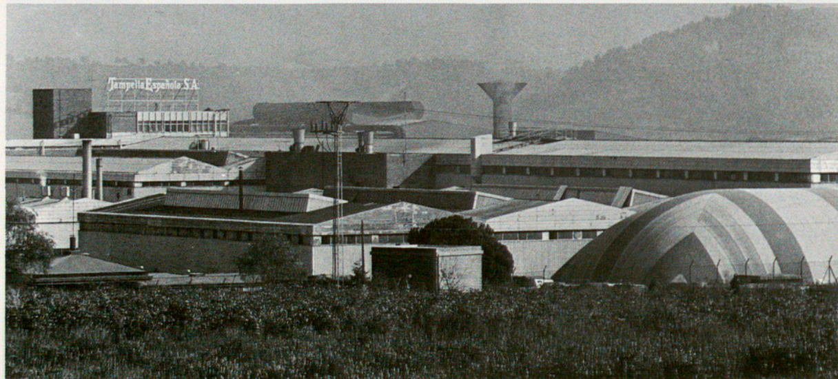
Zona industrial, des de l'autopista de Martorell, al sud de Castellbisbal