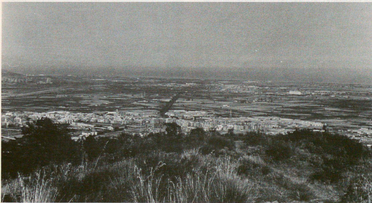
Sant Boi en primer terme, Sant Feliu al fons i Cornellà a la dreta

Actualment es superposen diferents delimitacions supramunicipals, que responen a diferents serveis administratius. A Catalunya, la Divisió Territorial aprovada per la Generalitat l'any 1936 estableix una comarcalització amb criteris més generals.