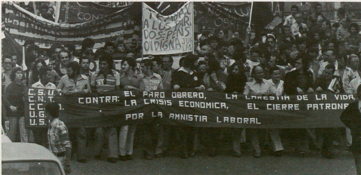
Manifestació contra l'atur al Baix Llobregat

La coordinació entre els ajuntaments és necessària i possible