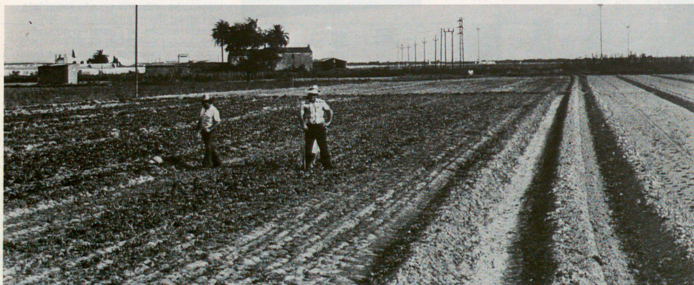
Camps del Prat de Llobregat