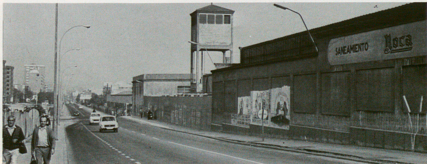
L'empresa Roca, de Gavà