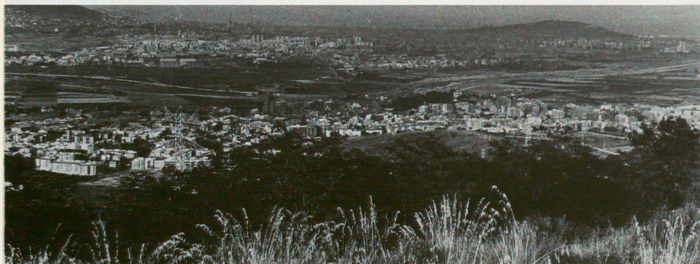
Panoràmica del Baix Llobregat des de la muntanya-monestir de Sant Ramon