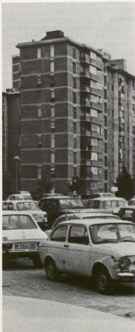
Blocs i més blocs. Sant Ildefons o "Ciutat Satèl·lit" de Cornellà

Pel que fa a les despeses financeres, s'aprecia que els municipis de la comarca en conjunt han seguit el model general de comportament consistent en un endeutament