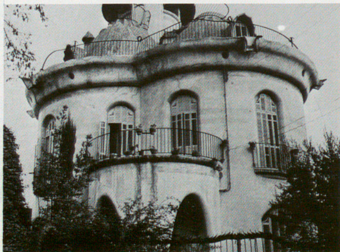
Art al Baix Llobregat: la Torre de la Creu de Sant Joan Despí, que acull un Centre de Dia psiquiàtric de la Diputació de Barcelona, i el Castell del Papiol