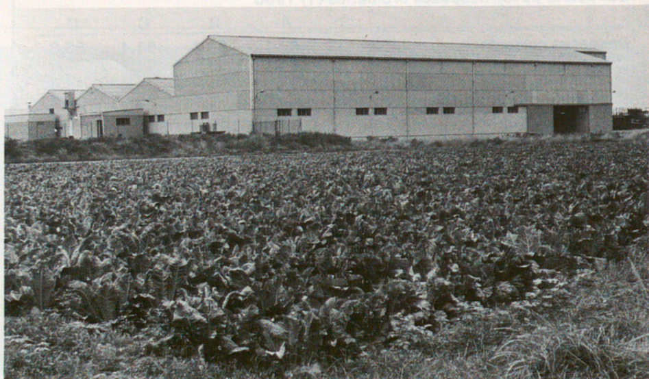
El Prat de Llobregat: camps i indústria

Si bé l'abast de les dades emprades no permet establir conclusions de validesa general, creiem que es pot destacar el pes important de l'endeutament en el finançament de les inversions i la seva contrapartida, l'escassa entitat de l'aportació del pressupost ordinari que es podria considerar com l'estalvi municipal. Cal advertir que la importància de les contribucions especials es deu en bona part a un dels municipis de la