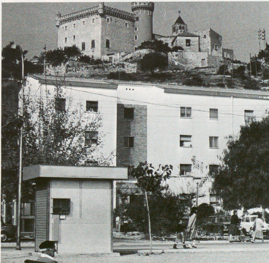
L'abans i l'ara: el castell de Castelldefels, les cases a sota