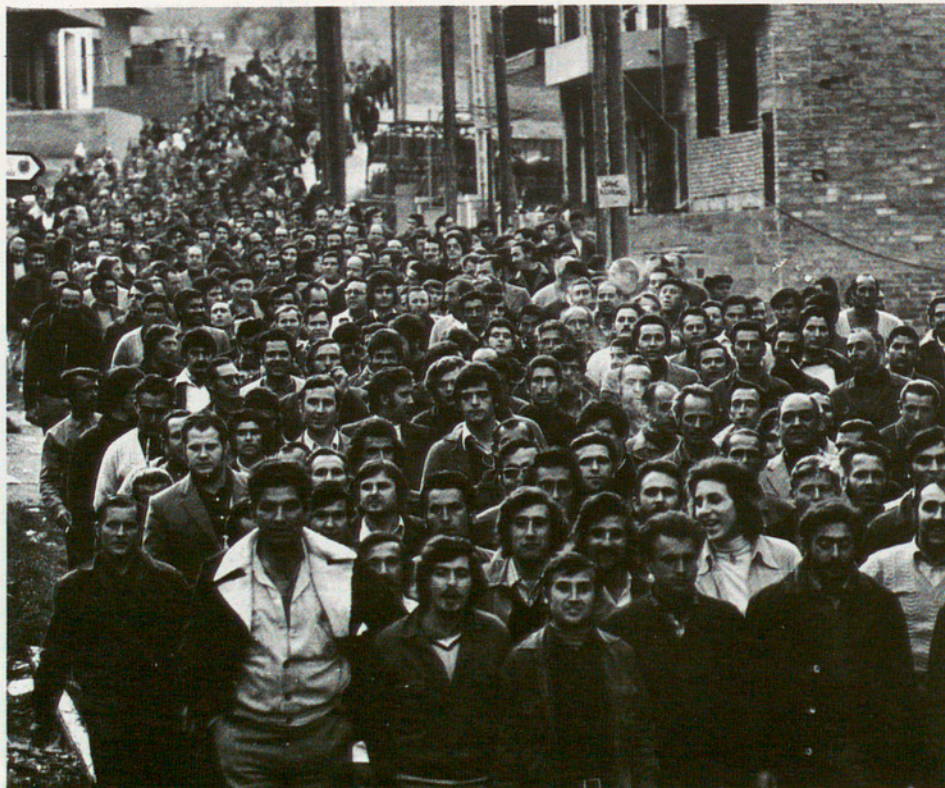
Els obrers de Roca, en vaga, es manifesten. 1976

Pel que fa a l'estructura dels ingressos ordinaris (vegeu quadre n.º 3) no s'observen diferències importants, però això no ha de sorprendre donada l'existència d'un marc legislatiu uniforme que regula els ingressos locals. Pel que fa als impostos directes, el major pes d'aquests a la comarca del Baix Llobregat que al conjunt català