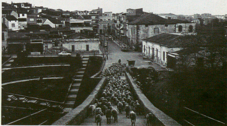
Barri Riera de Cornellà: els contrastos de la perifèria

Aquesta contradicció entre personalitat definida i manca d'independència funcional de Barcelona ja va fer-se palesa en la ponència de la PTC del 1933: mentre l'enquesta de municipis dona una clara unanimitat de pertànyer al Baix Llobregat(5), l'estructura de mercats feia pivotar la majoria dels pobles del Baix Llobregat entorn de Barcelona, excepte els de la rodalia de Martorell amb mercat en aquest nucli urbà.