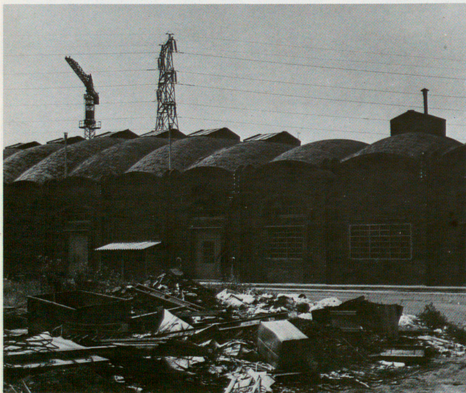
Can Begueria, al barri del Padró, de Cornellà

La xarxa d'equipaments i la d'infraestructures subcomarcals ha de ser el punt de màxima atenció per reforçar les conurbacions del Baix