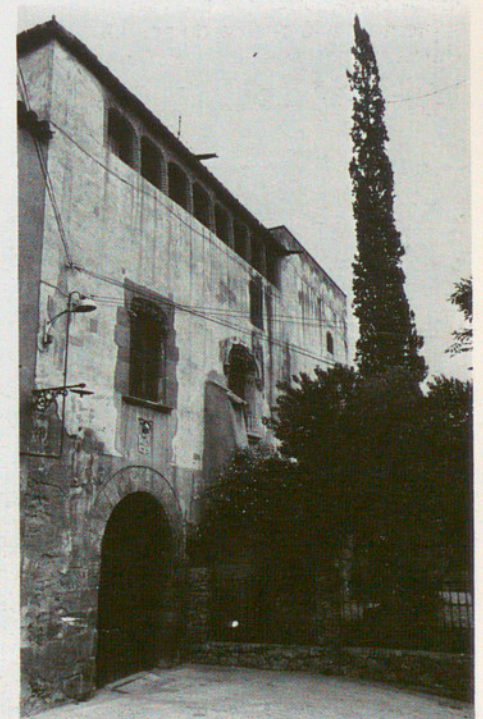
Casa on residí, a Sant Boi de Llobregat, Rafael de Casanova

carrer festivament, per celebrar el calendari folklòric, per mirar d'atraure els infants cap a un cert tipus de festa, per recuperar noms de carrers o per subvencionar algunes activitats (musicals, d'esplai, pictòriques), més el suport a alguns premis literaris (Vallirana, Sant Feliu, Martorell), així com l'elaboració d'un primer catàleg del patrimoni arquitectònic..., entre altres, han estat aportacions positives. Tanmateix, el bloqueig econòmic de la majoria d'aquests ajuntaments, els conflictes no sempre ben resolts amb grups de pressió demagògica, el respecte acrític envers una pretesa concepció limitativa de l'anomenada «cultura popular» (terme sospitosíssim), una política d'intervencionisme directe (com si un ajuntament pogués tenir un projecte cultural comunicable, estalinianament!) expliquen que les coses són encara a les berceles, que l'acció cultural ha de comptar amb un clima favorable (menys sotmès a oportunitats electorals).