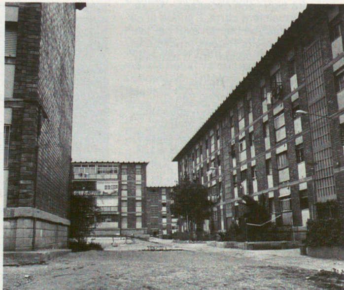
El barri Cinco Rosas de Sant Boi i el museu municipal de Molins de Rei: el Baix Llobregat és una comarca de contrastos amb un panorama cultural desolador