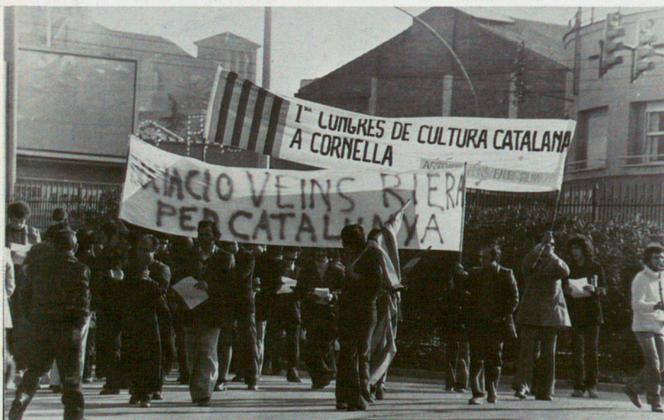
Manifestació, l'any 1975, a Cornellà: el primer Congrés de Cultura Catalana

Aquest preàmbul tenia sentit d'eix: tota proposta cultural per al Baix Llobregat haurà de fer front amb eficàcia a la inèrcia negativa que ens duu cap a la congelació. Entorpia cultural de signe fatalista que completaria l'acció dels anys cinquanta i seixanta, sota l'imperi –de conseqüències tràgiques– dels especuladors, dels Samaranchs, dels Figueres, dels Porcioles. El model urbanístic que ells van crear –el paradigma seria la «Ciudad Satélite de San Ildefonso»– explicaria el concepte de cultura que els movia. I hi ha marcs urbanístics que imposen, evidentment, límits insalvables a qualsevol activitat cultural normalitzada. Fins al punt que el professor Ros Hombravella, en un debat recent sobre la immigració a Catalunya, es veié obligat a dir –després de descriure el desgavell urbanístic imposat a tota la perifèria barcelonina– que només amb inversions econòmiques