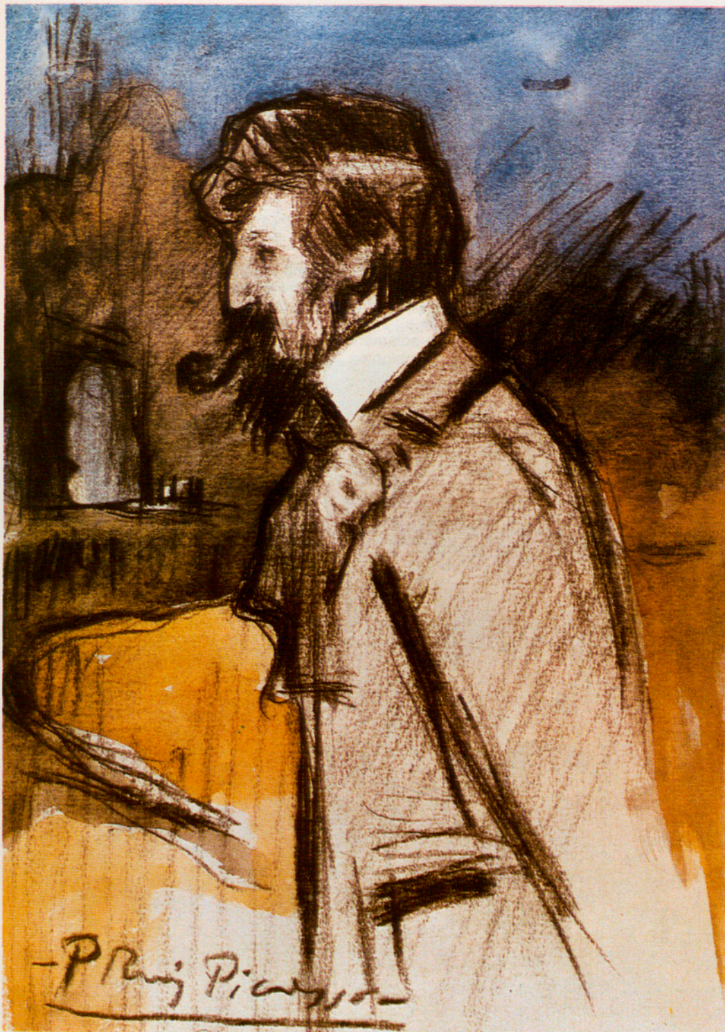
Retrat de Santiago Rusiñol pintat per Picasso