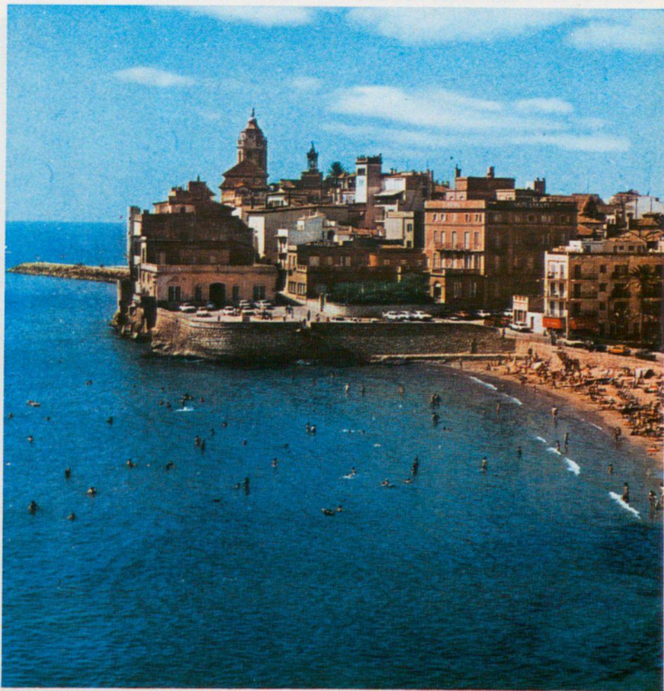
Visió de Sitges, la blanca Subur, amb l'església —original del segle X i renovada diverses vegades entre els segles XVI i XVIII— com a punt de referència definidor de la vila tocant a mar. De dreta a esquerra del lector, la quarta construcció en la primera línia és el Cau Ferrat, enganxat al Palau Maricel de Mar. Com a prolongació de l'església, el Palau Maricel de Terra, tots ells ben units a Rusiñol, especialment el Cau Ferrat, amb els seus vitralls arquejats