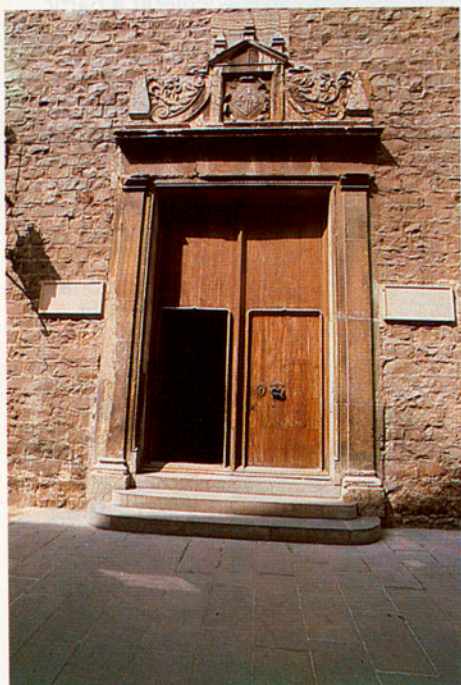
La Biblioteca de Catalunya i l'Institut d'Estudis Catalans tenen la mateixa entrada.

De cara a l'interior del país, potser la tasca més espectacular, per les seves repercussions urbi et orbi , va ser la de