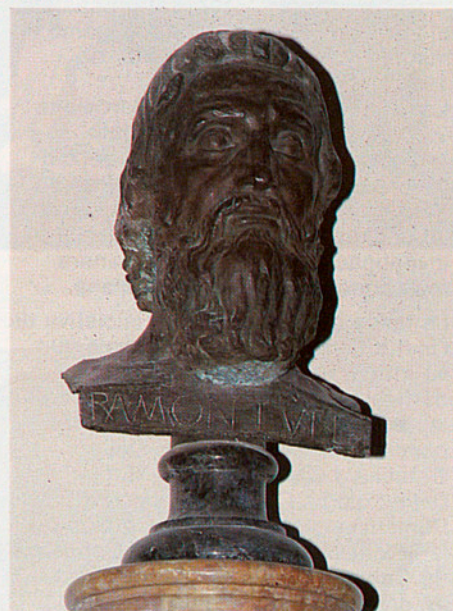
Porta d'entrada a la sala de lectura Rubió, que es troba al costat de la sala indicada en la foto anterior, i sala d'espera dels despatxos del president i secretari general de l'Institut. A la porta de la Biblioteca hi ha el bust d'Antoni Rubió i Lluch, primer president de l'Institut, i dins la sala de lectura el de Ramon Llull. Ambdós bustos són de Clarà i aviat, també a la porta de la Biblioteca, hi haurà el bust de Jordi Rubió i Balaguer, primer director de la Biblioteca de Catalunya, mort el passat 25 de juliol de 1982.

El debat sobre el futur de l'Institut d'Estudis Catalans resta obert. Després de 75 anys continuen presents les paraules de Prat de la Riba el 1907: «L'afirmació de la llengua catalana no serà definitiva sinó quan en ella hauran parlat a tot el món culte matemàtics, històlegs, psicòlegs, investigadors de la química, dels astres, o de les condicions biològiques al fons del mar».