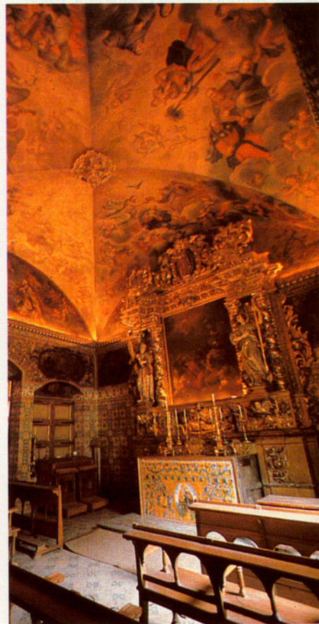
La històrica capella de la Casa de Convalescència, amb les famoses pintures de Josep Viladomat (1678-1755), el pintor més gran que produí Catalunya en aquells temps, especialitzat en temes religiosos i paisatgístics.