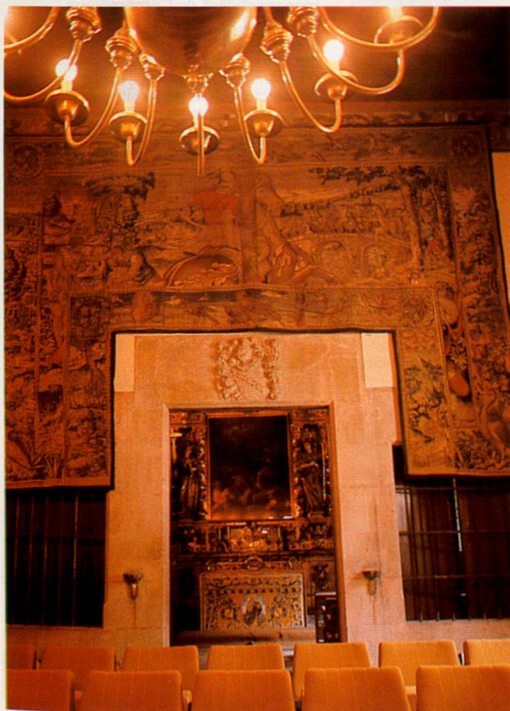
Vista parcial del darrer sector de la nova Sala d'Actes de l'Institut, la porta al fons de la qual comunica amb la històrica capella (vegeu fotos posteriors) de la Casa de Convalescència. La renovada Sala d'Actes té una capacitat per a 150 persones assegudes i s'hi realitzaven les grans sessions de l'Institut els anys 30. També se celebrà en aquesta Sala l'acte de devolució dels locals de la Diputació a l'Institut el 12 de juliol de 1977. Aquesta Sala era abans el dormitori de la Casa de Convalescència i aquí, a partir d'ara, el secretari general de l'Institut, Ramon Aramon, farà cada any, com era tradicional pels voltants de Sant Jordi, la ressenya pública de les tasques de l'Institut, amb motiu de la Festa anual de l'IEC. (Foto: Pere Monés).