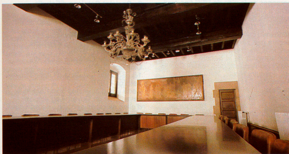
La nova Sala de Plens de l'Institut d'Estudis Catalans, al primer pis de la Casa de Convalescència, amb capacitat per a 50 persones. Aquí es trobaran a partir d'ara, periòdicament, els 28 membres numeraris de l'Institut, que cada dos anys elegeixen el Consell Permanent, òrgan directiu de l'IEC. Al fons, el quadre de Torres Garcia «La Filosofia, setena musa», presentada per Pal. las Athenea», encarregat per Eugeni d'Ors, secretari general de l'Institut de 1911 a 1920. (Foto: Antonio Espejo).

Entre 1911 i 1920, l'Institut d'Estudis Catalans va ocupar la Casa de Convalescència, amb capacitat per a 50 persones. Aquí es trobaran a partir d'ara, periòdicament, els 28 membres numeraris de l'Institut, que cada dos anys elegeixen el Consell Permanent, òrgan directiu de l'IEC. Al fons, el quadre de Torres Garcia «La Filosofia, setena musa», presentada per Pal. las Athenea», encarregat per Eugeni d'Ors, secretari general de l'Institut de 1911 a 1920. (Foto: Antonio Espejo).