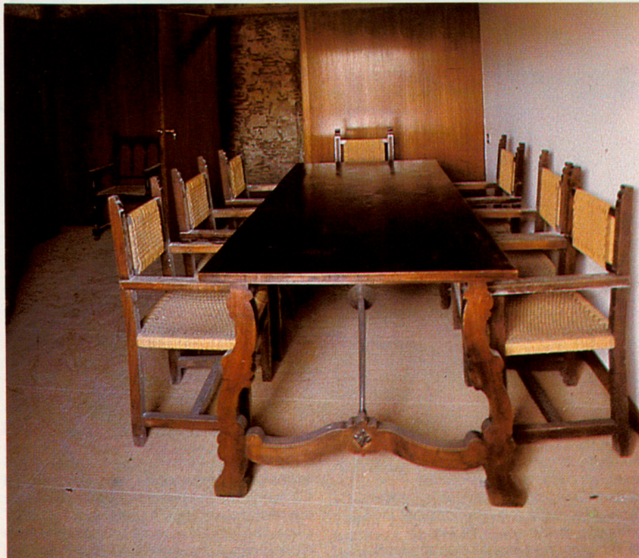
Dues sales del segon pis, per a reunions de tot tipus. En total, l'IEC ocuparà unes trenta estances noves, renovades, en tota la Casa de Convalescència, a la planta baixa i als dos pisos que la componen.