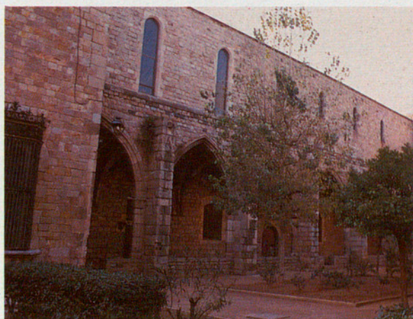
Dues vistes complementàries de la U que forma la Biblioteca de Catalunya, amb el pati de la Creu o antic pati de l'Hospital al mig.