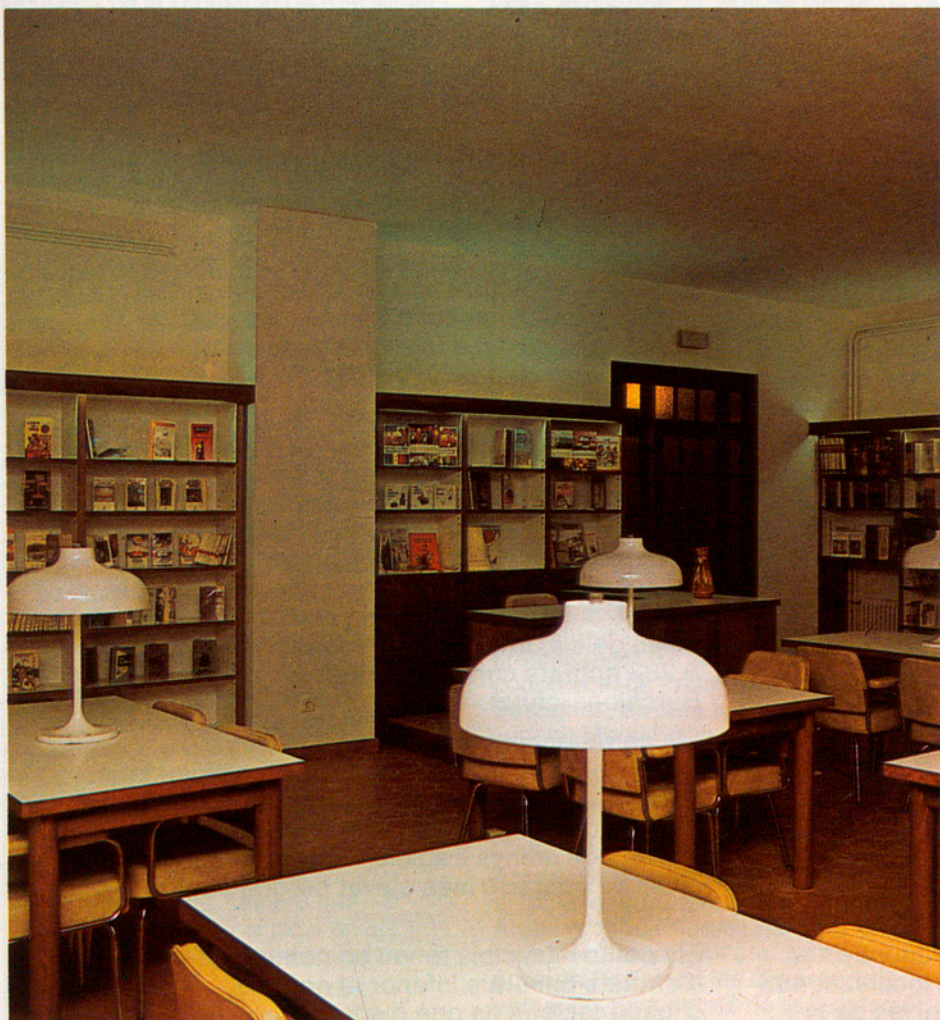
La sala de lectura per a nens, en el mateix primer pis de la Biblioteca.

Els artístics sostre i arcades del segon i darrer pis de la Biblioteca. La seva renovació ha estat duta a terme sota la direcció de l'arquitecte de la Diputació Jordi Querol, que plantejà una renovació d'una casa del segle xv reforçant-ne tota l'estructura interior, i en especial els vics ocults com els tèrmits, refent-la amb un objectiu funcional i de revaloració del tresor històric-artístic que significa. Així Vilafranca compta ja, a més de biblioteques escolars i privades, amb tres biblioteques: la Torras i Bages amb 17.000 volums, la Biblioteca de la Caixa de Pensions de Catalunya i Balears amb 12.000 volums, i les diferents biblioteques del plural Museu de Vilafranca, com l'arxiu bibliogràfic, el de protocols, el de la comunitat de preveres de Santa Maria, la biblioteca de l'Institut Penedèsenc, la de temes del vi i la col·lecció de llibres sobre ceràmica del doctor Bonet. Aquest fons bibliotecari, les tres revistes comarcals editades a Vilafranca, i tantes altres expressions culturals, complemen no solament la capitalitat econòmica sinó també cultural de la vila de Vilafranca, capital de l'Alt Penedès, amb 25.000 habitants.