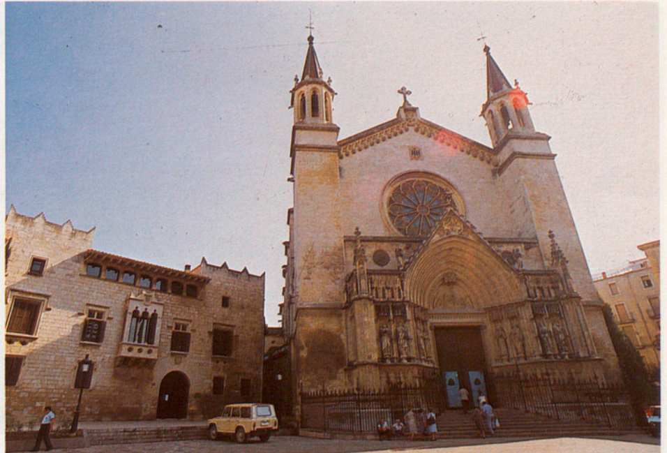
El Palau Baltà i la Basilica de Santa Maria.

Pel que es refereix a la vessant pedagògica, en la qual s'ha treballat molt estretament amb la delegació municipal d'Ensenyament, hi ha hagut una actuació directa sobre les escoles, fonamentalment en reparacions i millorament de les instal·lacions escolars: l'Ajuntament democràtic hi ha