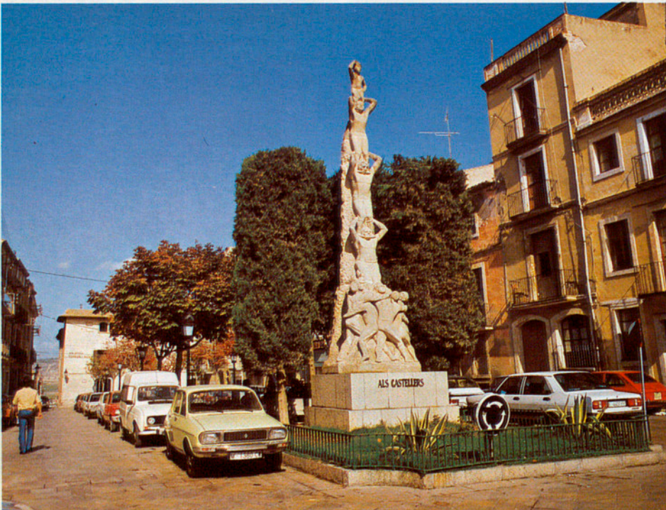
Al fons, la Basílica, i enfront, el Museu del Vi. Al mig de la plaça, el monument als Castellers.

documents. Llavors, la utilitat del futur Arxiu encara seria més important.