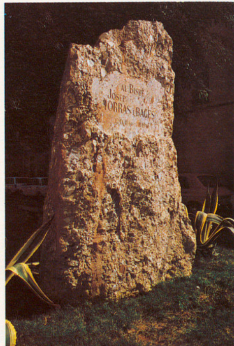
El monòlit-monument al bisbe Torras i Bages, a la plaça del l'Oli, davant la Biblioteca.