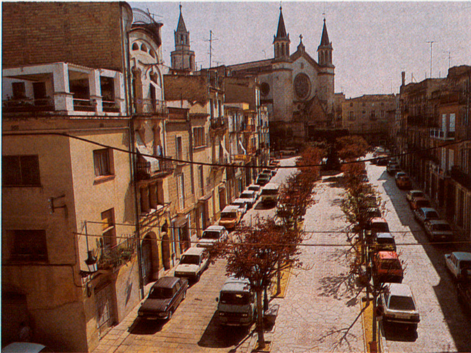
Aquesta és la vista de la Plaça Jaume I, des de la Biblioteca Torras i Bages, que es troba a la Plaça de l'Oli.

El Teatre i l'Ateneu municipals, amplien la infraestructura cultural del municipi vilafranquí