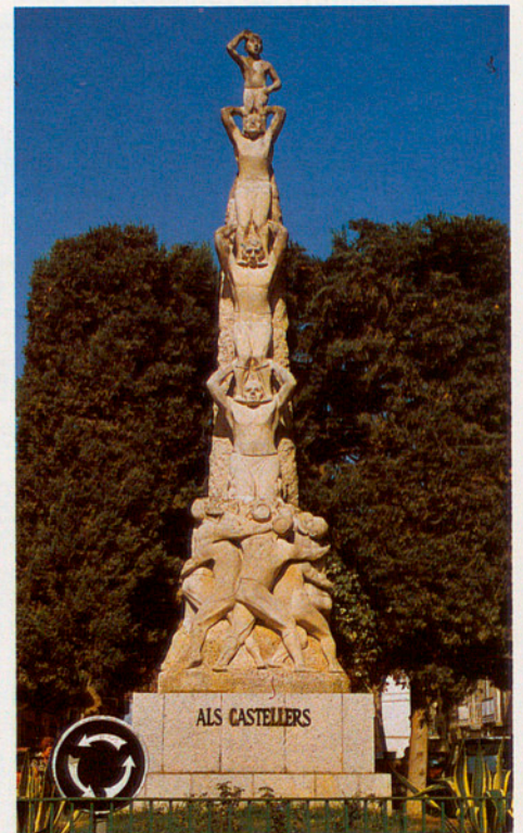
Dues vistes del monument «Als castellers», que tenen a Vilafranca la seva històrica seu i una constant i gloriosa tradició. Al fons, la Biblioteca Torras i Bages.

D'altra banda, encara també en aquest aspecte de la creació d'infraestructura per poder desenvolupar activitats culturals, cal destacar la fundació del Teatre Municipal -Cal Bolet. El centenari Teatre Principal (conegut posteriorment per Cinema Bolet -el seu propietari-, o Cal Bolet), ha estat reparat i comprat per l'Ajuntament amb el suport de la Diputació de Barcelona, i ha esdevingut així una instal·lació pública des del 29 de maig d'enguany. S'hi fan obres teatrals i recitals musicals de qualitat, a preus reduïts, i també ha continuat servint de fòrum electoral dels diversos partits que han concorregut a les eleccions. En definitiva, és un espai de formació ciutadana i obert a qui el necessiti.