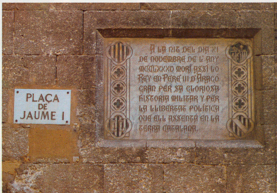
Placa a la paret del Museu del Vi. Aquest Museu, junt amb la Basílica, el Palau Baltà, el monument als castellers i