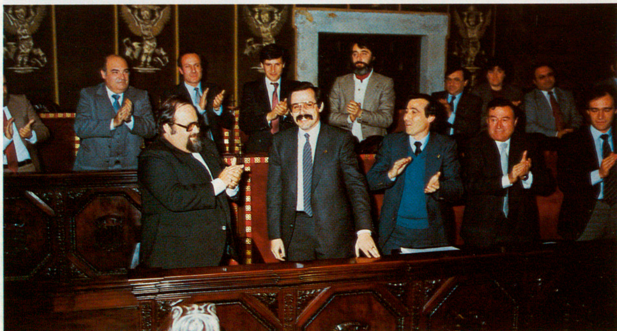
Aplaudiments per al nou President.

M'agradaria ara, i amb la brevetat que exigeix un acte ja carregat de prou discursos, fer davant vostre i en veu alta algunes reflexions sobre allò que penso de l'etapa que avui s'obre al nostre davant.