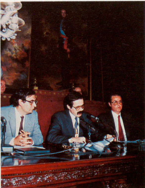
Primer discurs del nou president de la Diputació de Barcelona.

En definitiva, tots portem darrera nostre una representació popular que ens obliga i ens estimula. Perquè allò que els qui ens han elegit ens exigiran demà no és una capacitat infinita sinó un esforç i una dedicació completa. Per la meua banda, sempre m'he posat per norma en aquest terreny una idea que Antonio Gramsci va saber expressar amb