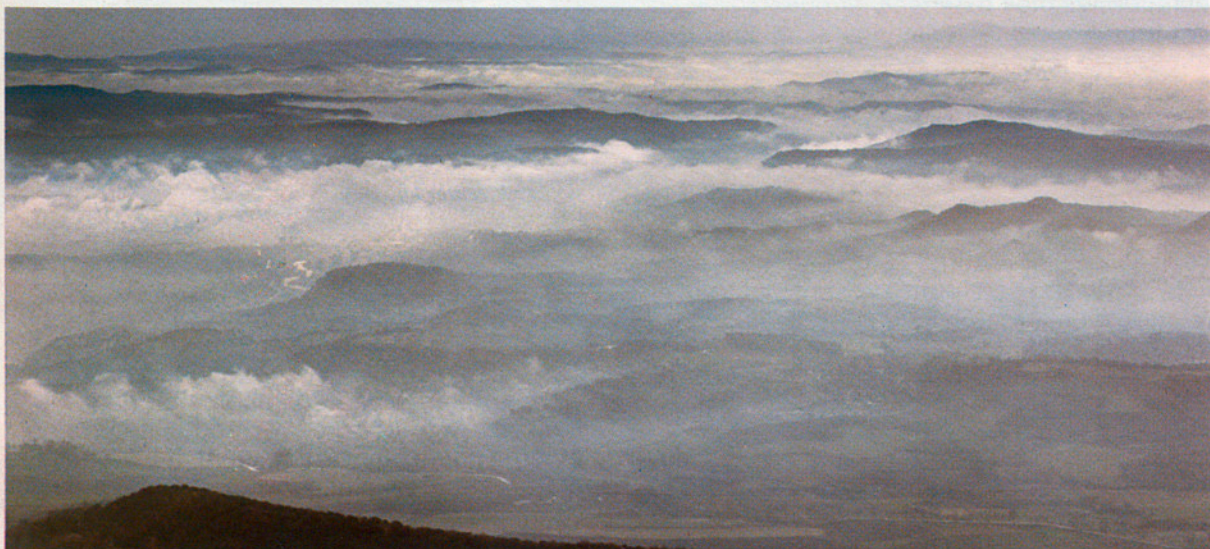
El Baix Berguedà ens ofereix una suavitat del territori –successives plataformes estructurals i relleus d'erosió– que contrasta fortament amb la resta de la comarca.