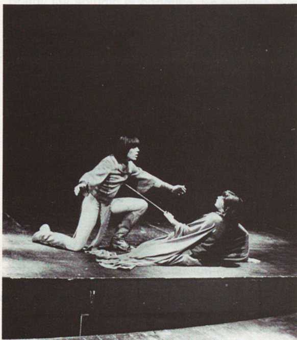
Ja fa temps que a Catalunya, i a Barcelona concretament, s'identifiquen els productors i els consumidors de cultura. Només cal anar a una estrena teatral per comprovar-ho. Tothom és professional de l'espectacle i tots se saluden com a vells coneguts que són.

el casament anunciat es produís, i tots vam assistir a l'ajuntament de la democràcia amb la vella dama de la cultura catalana. Finalment tot semblava arreglat. La democràcia ja tenia cultura –atrofinada, però amb un nom que Déu n'hi do– i la vella dama de tantes batalles bellíssimes, encara que militarment insignificant, trobava el pressupost que li permetria gaudir dels darrers anys –els millors– de la seva vida. La felicitat hauria estat perfecta, si no fos pels greuges comparatius i les competències de tota mena que hi havia. Barcelona feia anys que es creia la capital cultural de la península i tenia presentada candidatura en el certamen europeu de capitals culturals. Els diaris –sempre tan imprudents– havien citat un conegut intel·lectual francès que ens augurava un futur esplendorós en el si de la cultura occidental. Seriem, finalment, els millors. Però l'alegria dura poc, a cal pobre. Ben aviat vam saber que «Madrid, castillo famoso», es recuperava ràpidament dels anys de la foscor i esdevenia un centre cultural de primera fila. La nostra cultura no era exportable i això sempre és un signe de malastrugança en qualsevol cultura que es respecti. Les editorials catalanes deien que començaven a emigrar cap a verals més sanitosos i la premsa catalana no superava l'estadi testimonial dels primers moments.