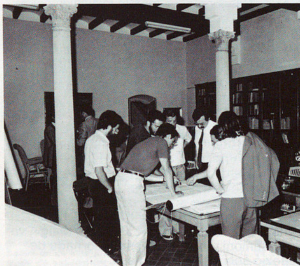
Empúries disposarà, en un termini breu, d'un nou Museu.

Les qüestions relatives al medi natural i el medi ambient, de salvaguarda i potenciació del nostre patrimoni ecològic, preocupen força la Diputació de Barcelona. El Servei de Medi Ambient de l'Àrea d'Agricultura continua les seves tasques d'investigació, resol problemes dels municipis i aporta iniciatives interessants, com és ara la signatura del conveni amb l'Institut Nacional de Meteorologia –dependent del Ministeri de Transport i Comunicacions–, que té com ha finalitat el control de la contaminació atmosfèrica a les nostres comarques. Els resultats i les expectatives de moltes d'aquestes qüestions són reflectits en unes excel·lents publicacions periòdiques. Precisament ha estat el Servei del Medi Ambient el que ha canalitzat els esforços per a la creació d'un Centre d'Estudis del Mar, a Sitges. La Diputació, que des de fa temps disposa d'una important presència cultural a la blanca Subur –la Diputació barcelonina és present a la Junta Assessora de Museus de la vila–, té ara la satisfacció d'endegar aquest centre. No cal dir que l'activitat que arribarà a desplegar respon –tant des d'una perspectiva professional com científica– a les preocupacions actuals pels problemes ecològics i marítims.