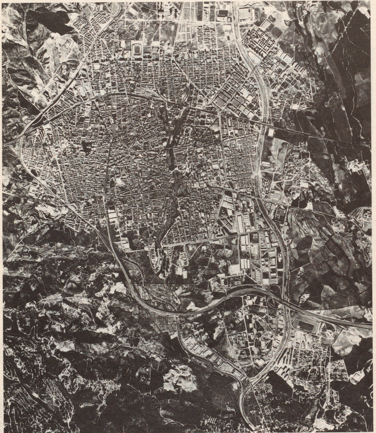
Vista aèria de la ciutat de Terrassa. S'hi distingeix perfectament l'actual torrent de Vallparadis, futur parc urbà que unirà tota la ciutat.