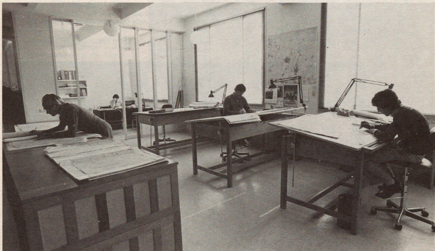
Una de les dependències de la Gerència Municipal d'Urbanisme de Terrassa en hores de treball.

Una vegada superada amb èxit la prova de la tramitació del pla general i engegades les figures bàsiques de planejament que estableix i ja consolidada l'experiència en el camp de la gestió, ha arribat el moment d'escometre'n la segona etapa prevista. Es preveu per una data no gaire llunyana l'adopció dels acords que han de permetre completar les transferències de competències a la gerència. D'aquesta manera Terrassa disposarà d'un instrument integrat, capaç d'abordar unitàriament i amb coherència l'aplicació de les determinacions urbanístiques a cada cas concret (resolució de sol·licituds de llicències d'obres i d'activitats), així com els mecanismes aptes per vetllar per l'estricta compliment de la disciplina urbanística (funció inspectora).