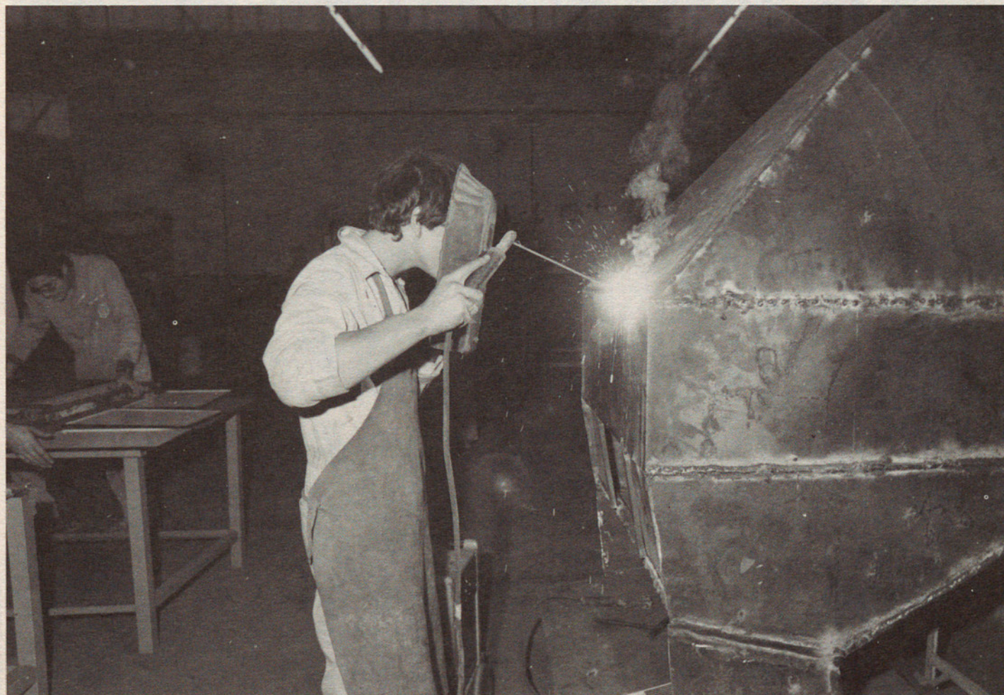
La Fornal, la cooperativa del ferro, utilitza de moment els tallers de Flor de Maig. Ben aviat es podrà instal·lar pel seu compte.

L'objectiu d'aquestes jornades respon a l'esforç que fan els centres de formació professional especial per intercanviar informació i debatre les experiències recollides aquest darrers temps per l'escola de formació especial i el