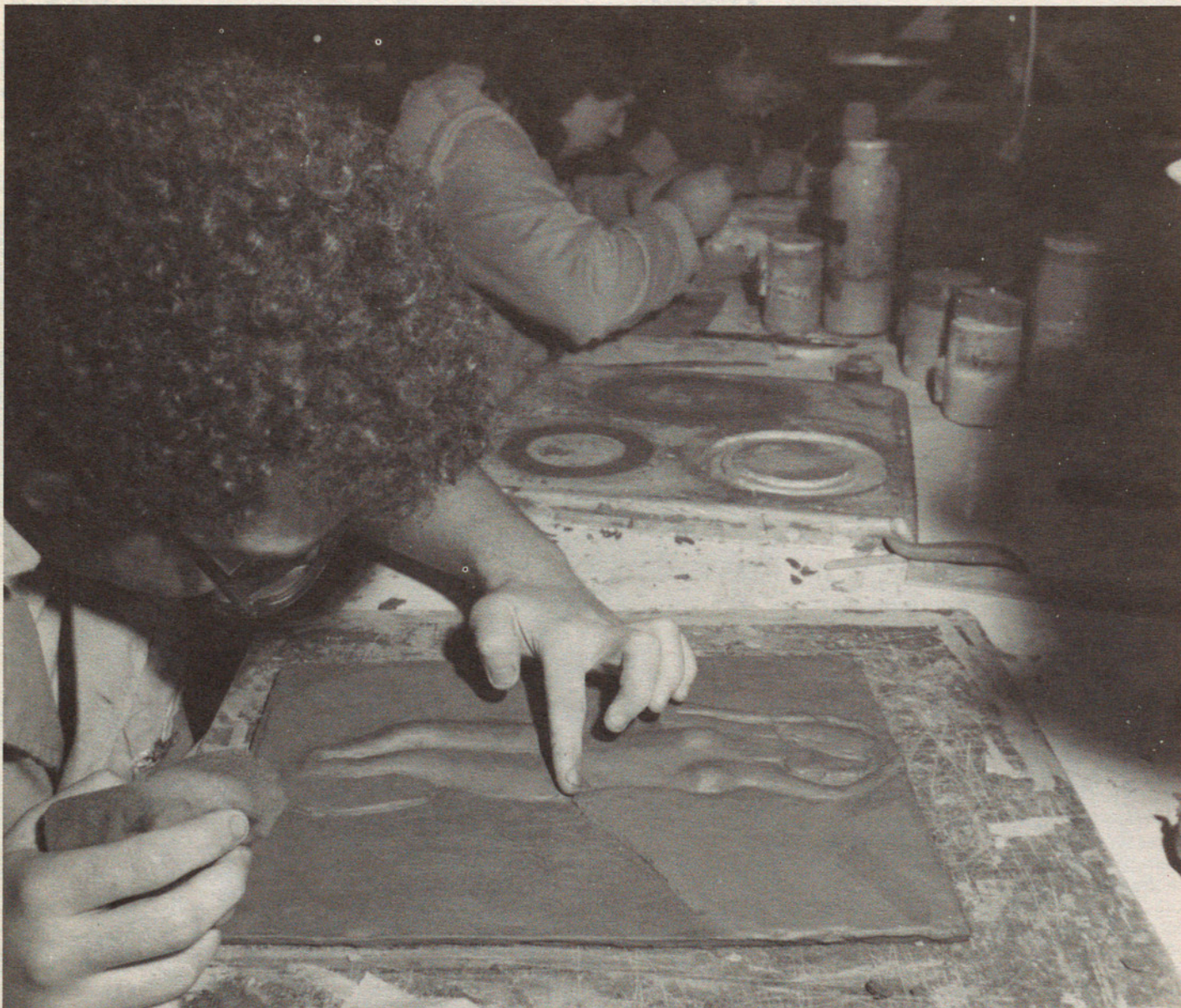
El fang pren vida pròpia en mans dels alumnes. El taller de ceràmica és el lloc de trobada dels joves amb més capacitat artística.