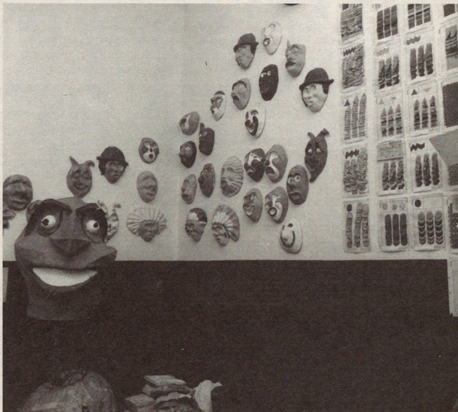
Amb paper de diari i amb paper de colors es pot fer tot això: és una de les primeres coses que descobreixen els alumnes de la Flor de Maig.

tant la formació professional del noi que no pas de la noia deficient, que sempre pot fer les feines de casa sense representar una càrrega excessiva».