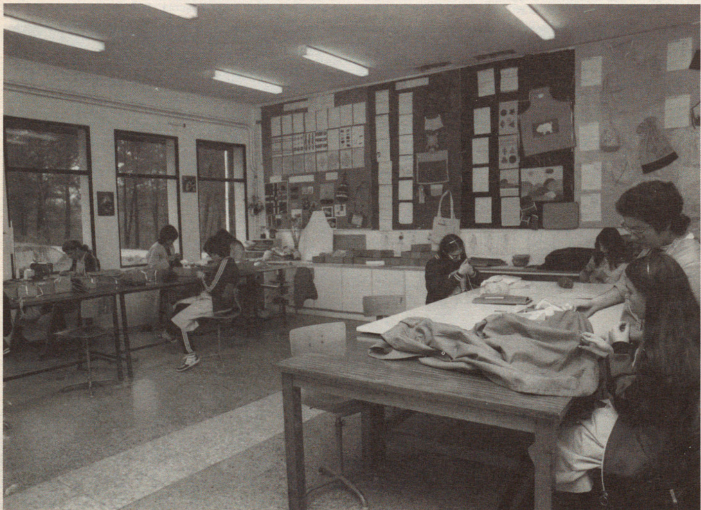
El taller de costura i moda. Moltes noies que ja tenien un rol assignat -el de «quedar-se a casa»- es miren el futur amb més il·lusió.

A grans trets, els objectius d'aquest departament de col·locació són indagar el mercat de treball, de cara a refermar els aprenentatges i oficis amb possibilitats d'evolució futura, cercar noves formes d'integració laboral i sensibilitat