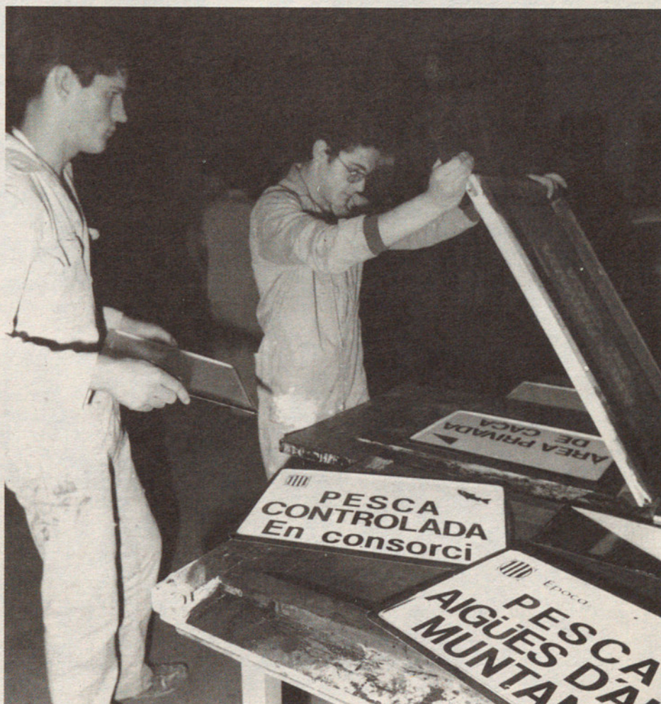
Rètols de senyalització encarregats pel departament d'Agricultura de la Generalitat de Catalunya: aquest va ésser el primer treball realitzat pels joves de La Fornal.