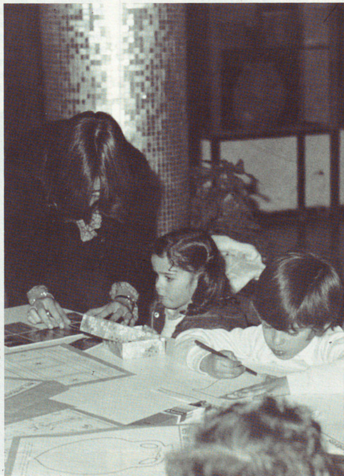
Les visites dels diumenges al matí contenen un plantejament didàctic adequat als diversos nivells.