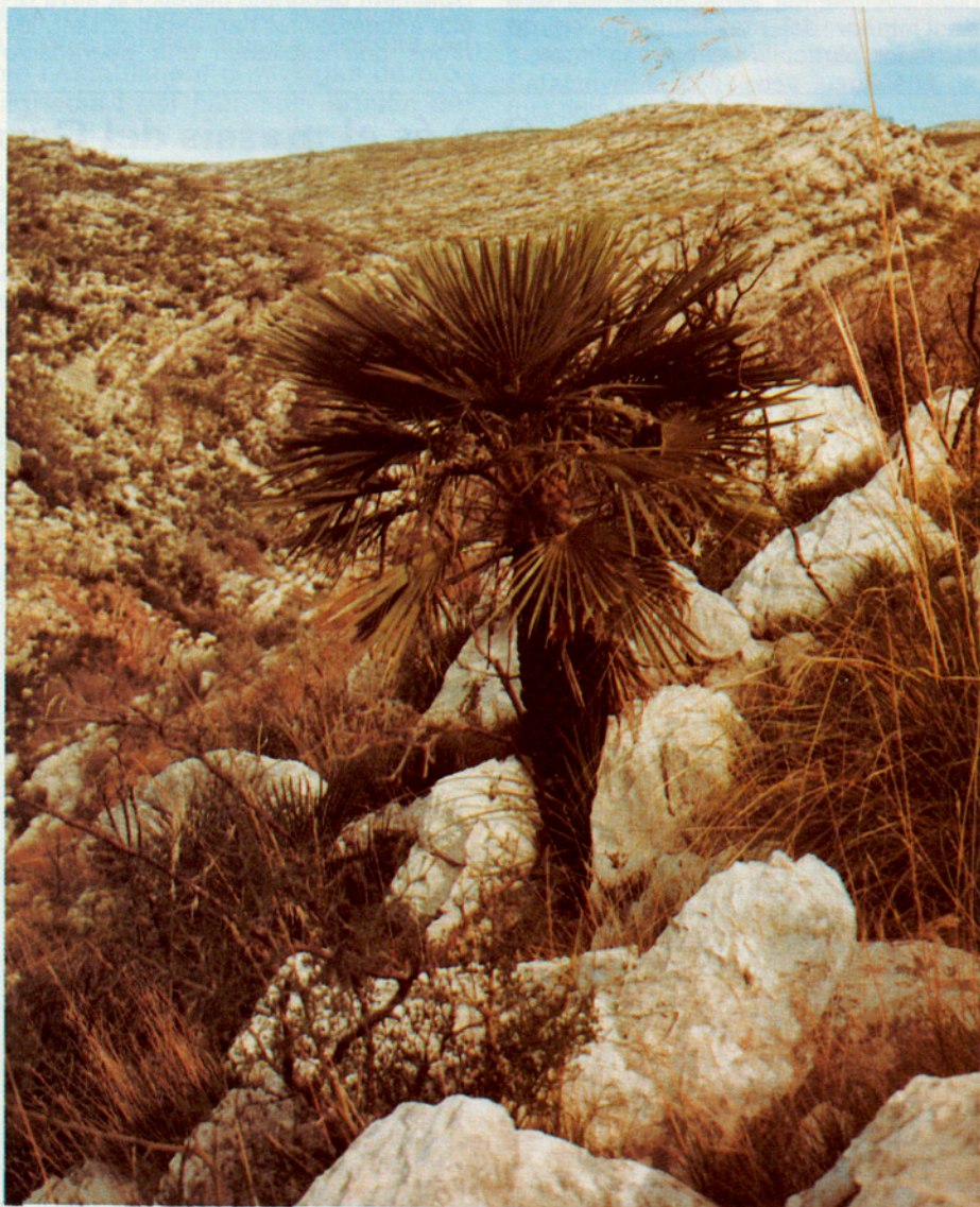
El margallo és una espècie vegetal que es troba sovint en el massís del Garraf, amb la particularitat que aquest indret és precisament en la part més septentrional on es pot trobar.

Considerada la peculiar situació geogràfica del Garraf, situat entre dues zones de clara vocació turística, el parc natural ha de constituir una alternativa complementària a l'oferta tradicional en aquesta matèria. Tampoc no s'han de perdre de vista d'altres sectors que, malgrat el seu caràcter minoritari, tenen en el Garraf una importància i una tradició singular, com són l'excursionisme, l'espeologia i l'escalada.