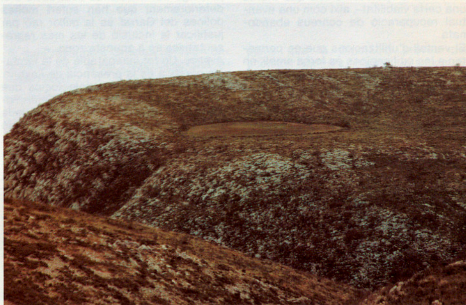
La dolina: una zona fèrtil entre les roques de carbonat càlcic, una de les moltes característiques del massís del Garraf.

La seva finalitat bàsica és la protecció i el desenvolupament harmònic del sistema de relacions entre el medi natural, el paisatge i l'activitat humana, ajustades a les exigències que imposen les