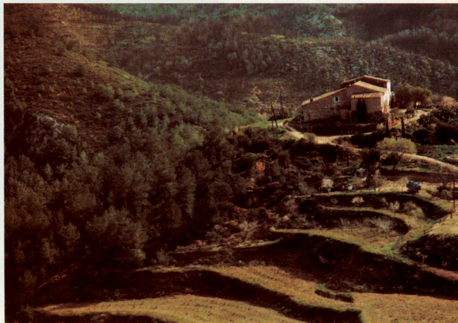
L'explotació agrícola és una de les activitats que potenciarà el Pla.