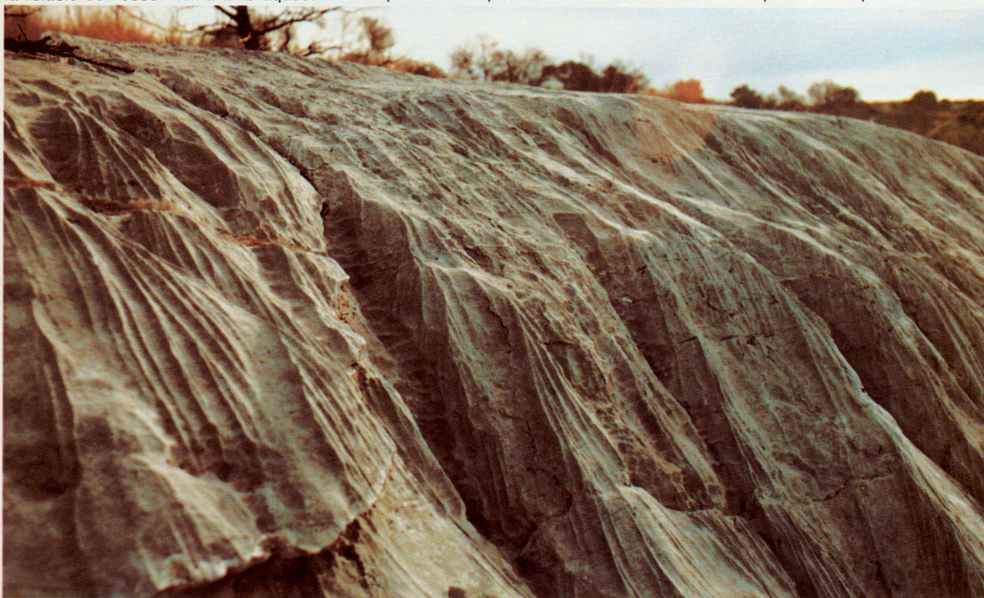
SERVEI DE PARCS NATURALS

Troblem al Garraf, així mateix, una continuada interacció entre l'activitat humana i el paisatge. Un «diàleg» que assoleix nivells d'allò més interessants. A hores d'ara, encara és possible llegir en les estructures i construccions que es manifesten arreu del massís les diverses etapes de tot procés històric: